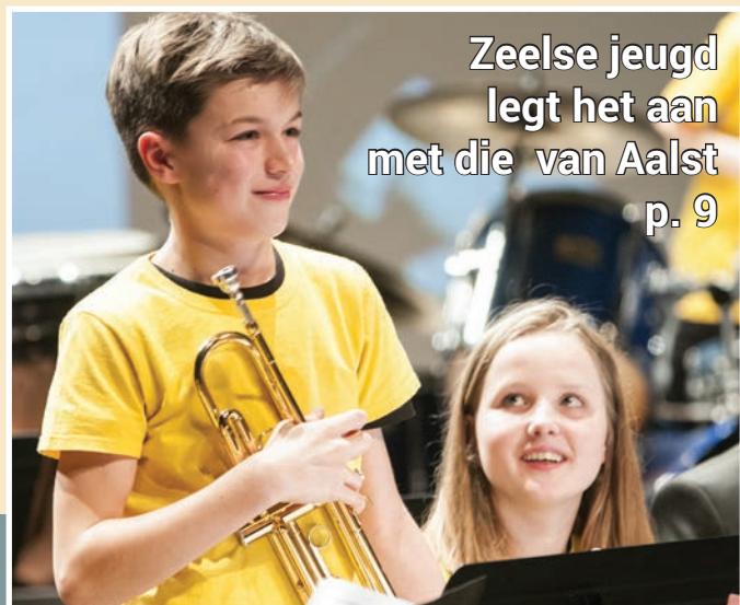
Zeelse jeugd legt het aan met die van Aalst p. 9