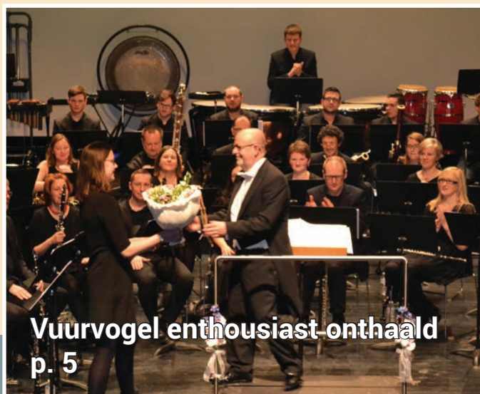
Vuurvogel enthousiast onthaald p. 5