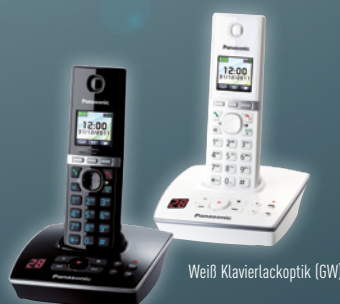
Schwarz Klaviertackoptik (GB)