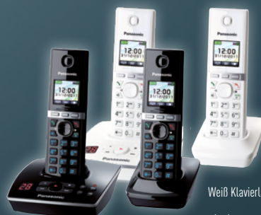
Schwarz Klaviertackoptik (GB)