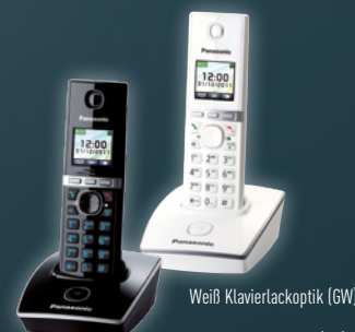
Schwarz Klaviertackoptik (GB)