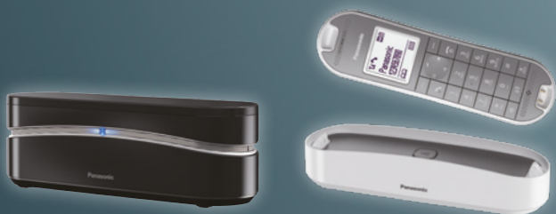
Schwarz Klavierlackoptik (GB)