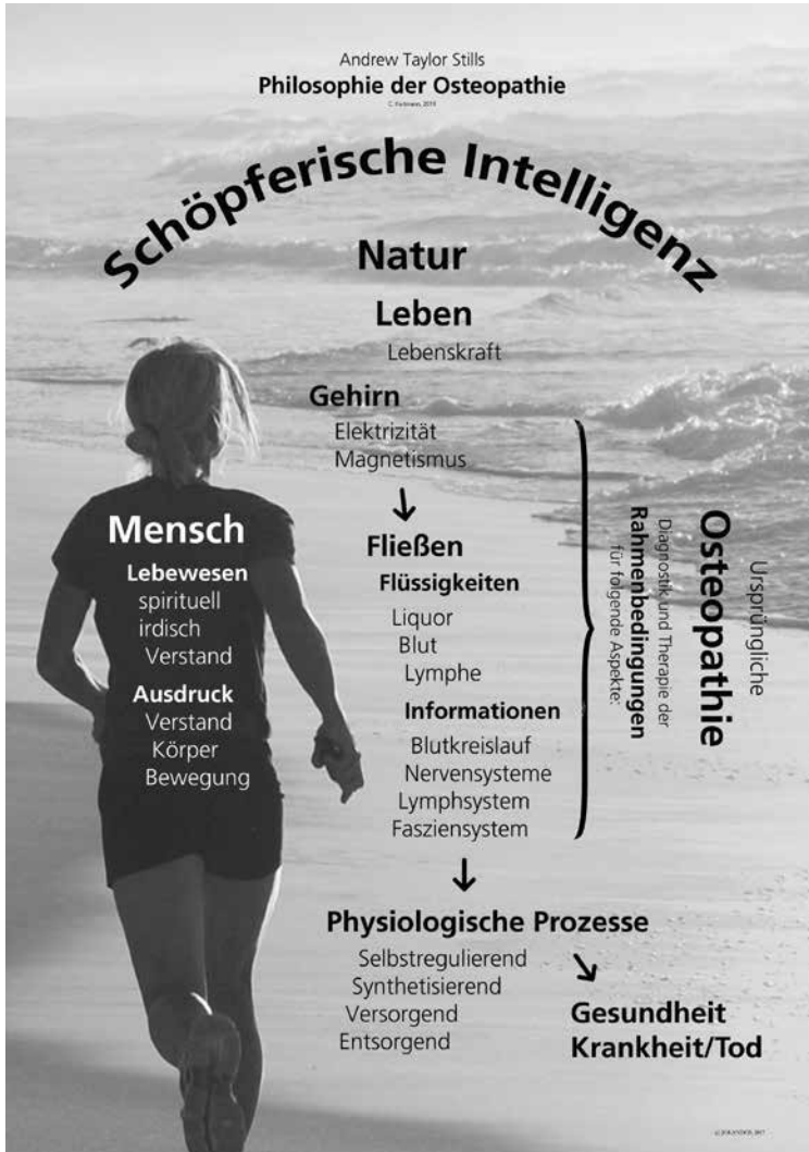
Abb. 2.: Andrew Taylor Stills Philosophie der Osteopathie.