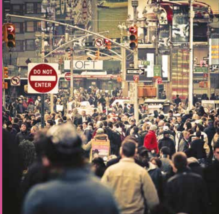
Street in New York, USA