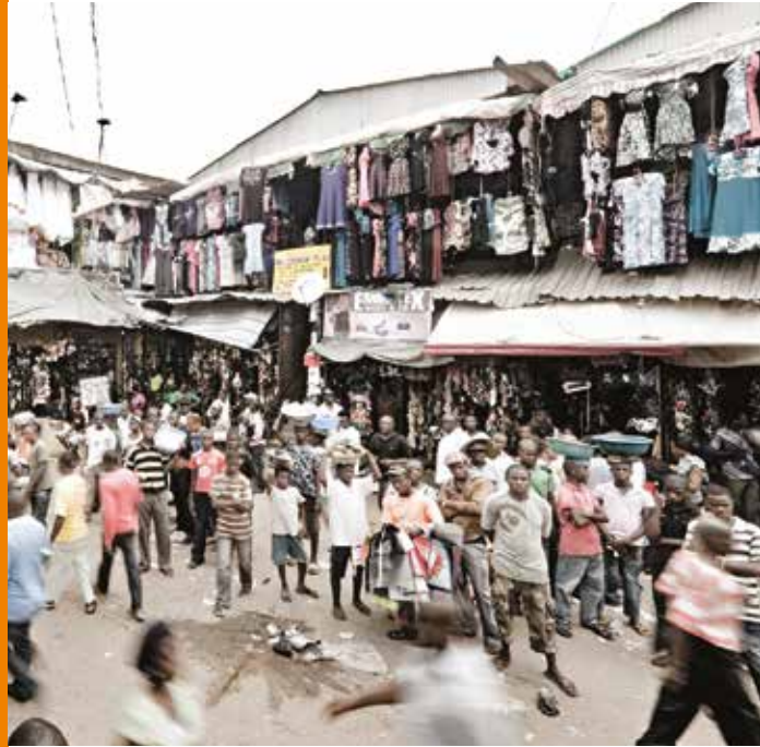
Market place at Onitsha, Nigeria