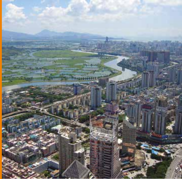
Aerial view of Shenzhen, China