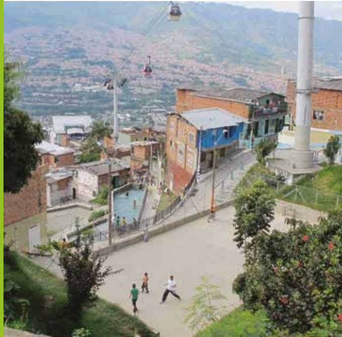
Public space in Medellín, Colombia