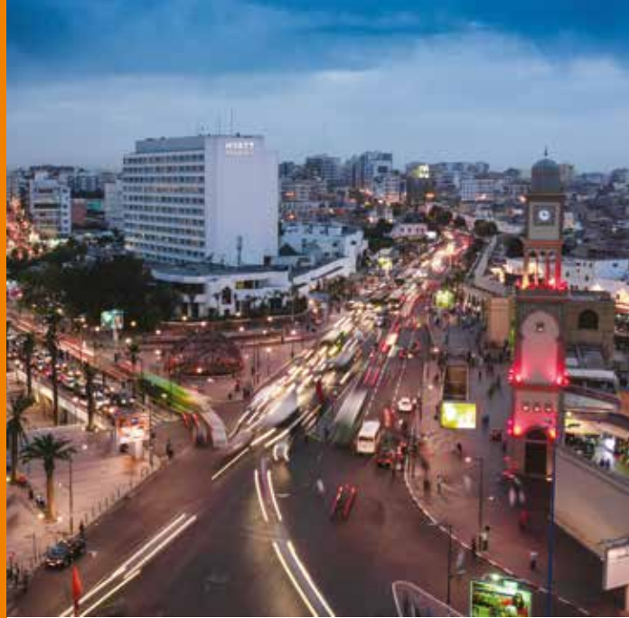
The United Nations square in Casablanca, Morocco

La planificación urbana y territorial y el crecimiento económico sostenid