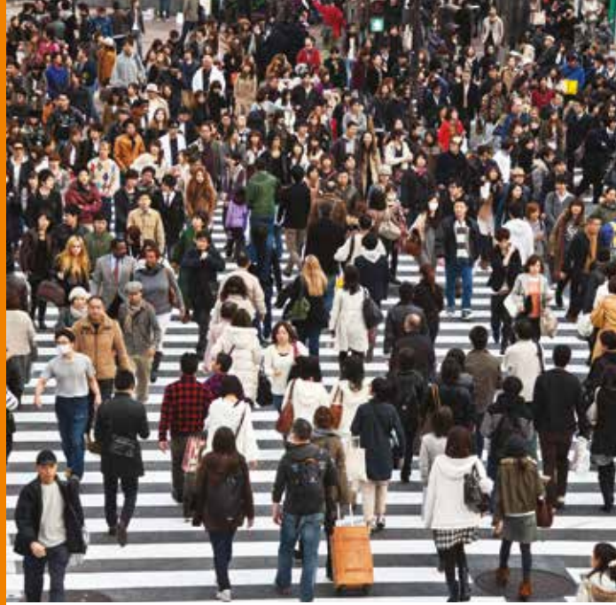
Pedestrians in Tokyo, Japan

La planificación urbana y territorial puede contribuir al desarrollo sostenible de diversas maneras. Debería estar estrechamente vinculada con las tres dimensiones complementarias del desarrollo sostenible: el desarrollo y la inclusión sociales, el crecimiento económico sostenido y la protección y ordenación del medio ambiente.