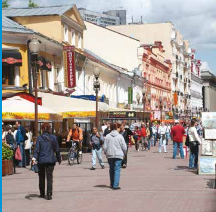
Pedestrian street in Moscow, Russia