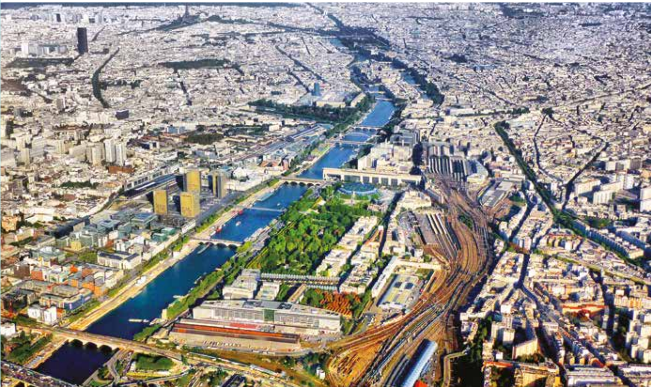
Aerial view of Paris, France