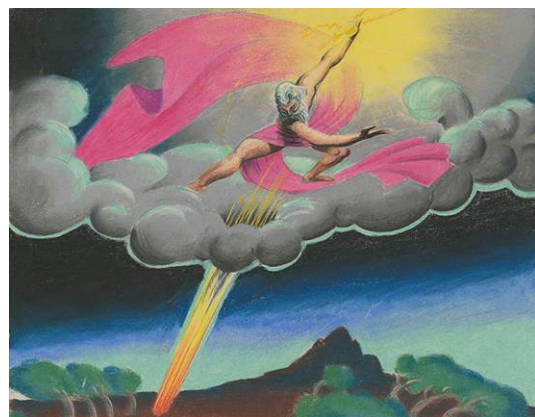
Fantasia, «La sinfonía pastoral», 1940 Estudio para la dirección de arte