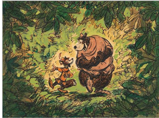
Robin Hood , 1973 Estudio para la dirección de arte © Disney

La narración épica Gest of Robyn Hode (Gesta de Robin Hood) apareció en la colección más antigua de libros impresos en Escocia, en el siglo xv. Robin Hood se representa siempre como alguien que toma de los ricos para dar a los pobres y que, por sus actos, fue proscrito por el gobernador de Nottingham por considerarlos delito de robo. El largometraje de Disney de 1973 tenía la prerrogativa de poder dar una nueva vida a la leyenda desde una perspectiva original y contar las aventuras de Robin Hood, según palabras del productor y director Wolfgang Reitherman, «a través de los ojos de los animales del bosque de Sherwood, que eran quienes conocían mejor a Robin». Así pues, Robin y sus compañeros de aventuras se convirtieron en personajes antropomórficos, animales con comportamientos humanos, muy populares en la tradición europea. Y de esta manera seguían perpetuando la leyenda, actualizándola en la cultura popular y haciéndola más accesible para el espectador, de la misma manera que los juglares lo hacían antaño.