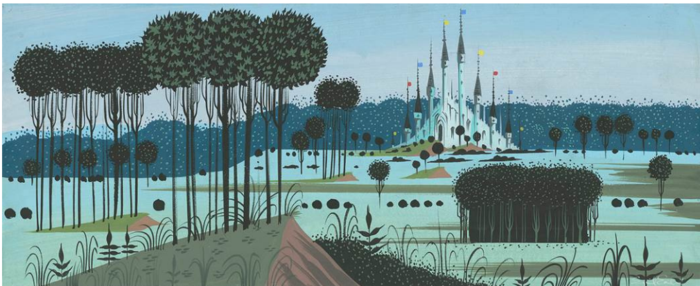
La bella durmiente , 1959. Estudio para la dirección de arte. © Disney

La muestra está estructurada en cinco ámbitos. Arranca en los estudios Disney originales, con sus mesas de dibujo y con una escenografía que nos transporta a la California de la época. A partir de ahí propone un recorrido imaginario en el que el visitante es protagonista: la cabaña y el bosque, escenario de fábulas y leyendas, el mundo de los tall tales en los que se desarrolla la prueba decisiva antes del desenlace, y finalmente el castillo, donde las historias de Disney siempre terminan bien.