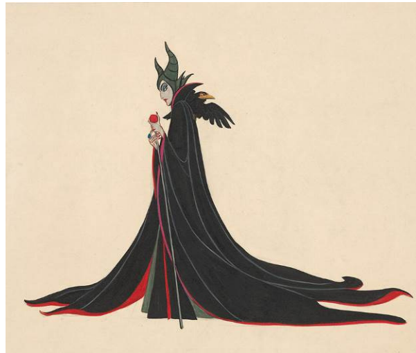
La bella durmiente , 1959 Estudio para la dirección de arte © Disney

Dentro de su programación cultural, la Obra Social "la Caixa" dedica una atención preferente a las manifestaciones artísticas fundamentales en la formación de la sensibilidad contemporánea. En esta línea se enmarcan las exposiciones dedicadas al cine, que, junto con la fotografía, constituye una de las formas artísticas más características del siglo xx.