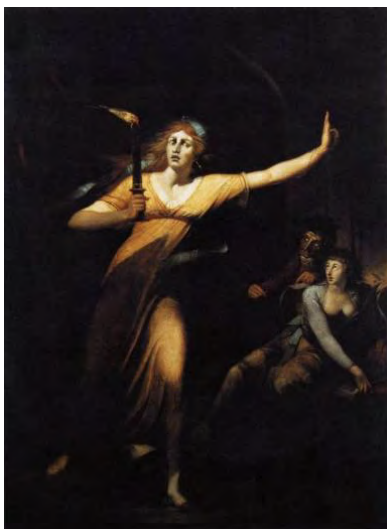
LADY MACBETH SOMNAMBULE, JOHANN HEINRICH FÜSSL, 1784, HUILE SUR TOILE MUSEE DU LOUVRE