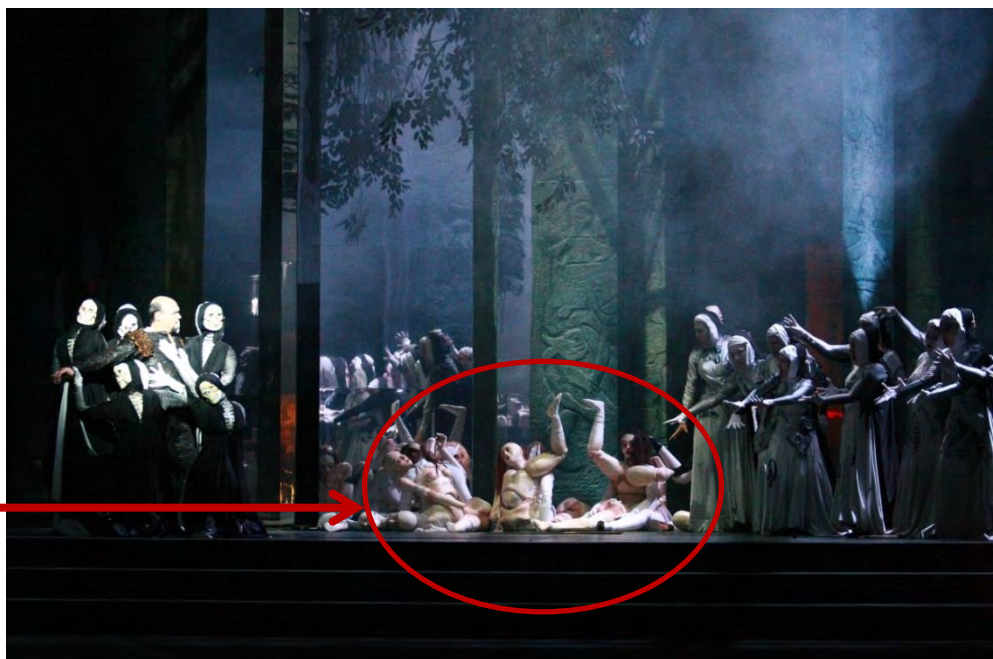
PHOTO DU SPECTACLE

REFERENCE, DANS LA MISE EN SCENE, A LA POUPEE D'HANS BELLMER