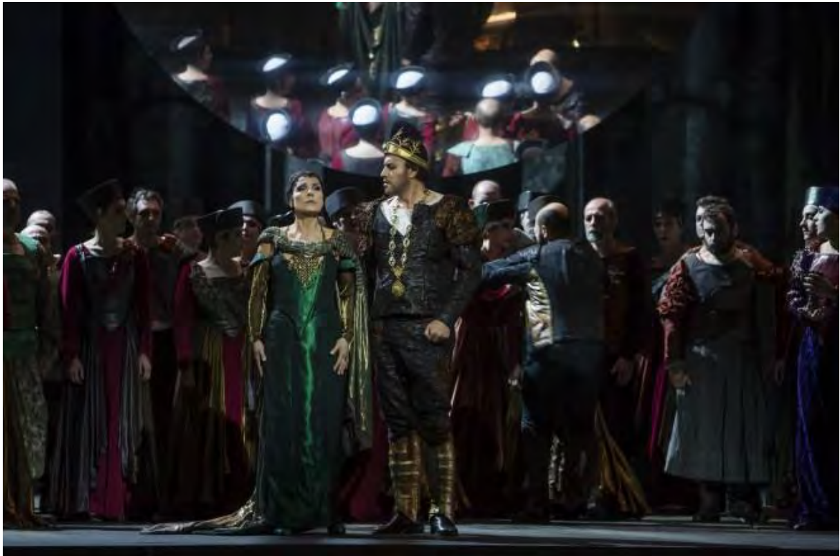
PHOTO DU SPECTACLE

« BIEN SOUVENT POUR NOUS GAGNER A NOTRE PERTE LES PUISSANCES DES TENEBRES NOUS DISENT LE VRAI, NOUS GAGNENT PAR RUSES HONNETES, POUR NOUS TRAHIR JUSQU' AUX PLUS GRAVES CONSEQUENCES »