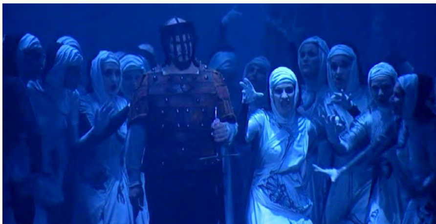
PHOTO DU SPECTACLE