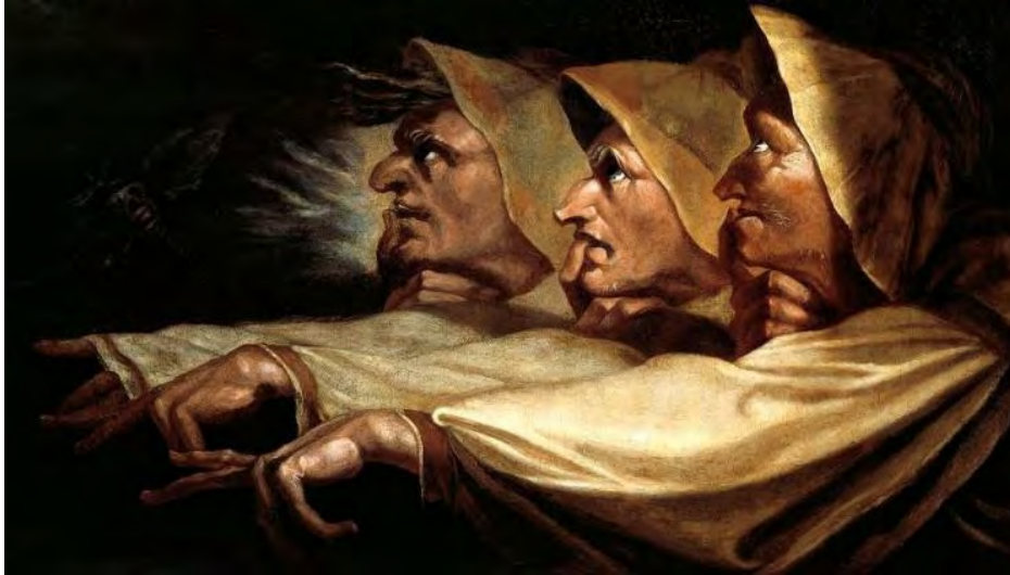
LES TROIS SORCIERES DE MACBETH PAR JOHANN HEINRICH FÜSSLI, HUILE SUR TOILE, 1783 KUNSTHAUS, ZÜRICH