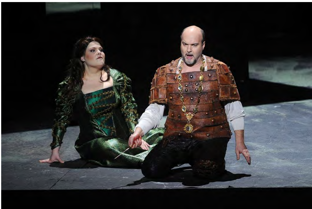
PHOTO DU SPECTACLE