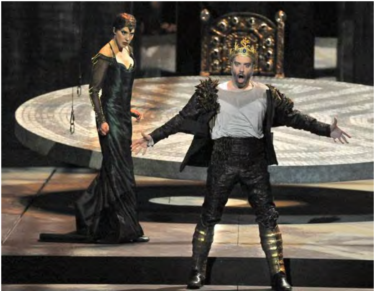
PHOTO DU SPECTACLE