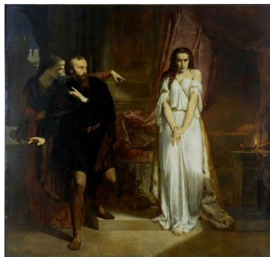
CHARLES-LOUIS MÜLLER, LADY MACBETH, 1849, HUILE SUR TOILE, AMIENS, MUSEE DE PICARDIE