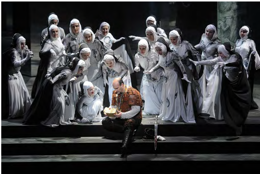
PHOTO DU SPECTACLE