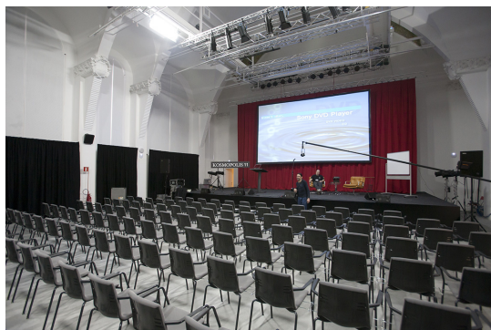
Imágenes del CCCB