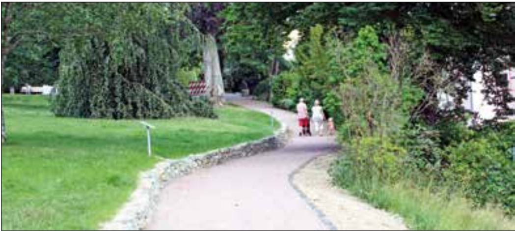
Kein Geländer, aber ein breites Bankett und ein Mäuerchen sichern den Weg am unteren Ende des Kurparks – parallel zum Seilerbahnweg – ab.

Königstein (hfh) – Viele Veranstaltungen und damit eine gewisse Hektik zeichneten die Zeit zwischen Ostern und den Sommerferien aus. Da gab es durchaus genug Aktionen im Kurpark, aber stets in der Nähe des Kurhauses. Dort gab es dann genug zu erleben, so dass ein Blick über die Rasenkante einfach ausgefallen ist. Einige Ankündigungen der Stadtverwaltung, verschiedene Maßnahmen auf dem Parkgelände umsetzen zu wollen, locken nun in ruhigeren Zeiten weiter ins Gelände und lassen tatsächlich einiges entdecken. So ist nach Jahren des unebenen Stolperns und anschließender Sperrung der Weg am unteren Rand des Kurparks – parallel zum Seilerbahnweg – wieder instandgesetzt worden – sicherlich kein leichtes Unterfangen, da der Teerweg sich teilweise offensichtlich Bewegungen des Hanges angepasst hatte. Dementprechend ist der neue – deutlich verbreiterte