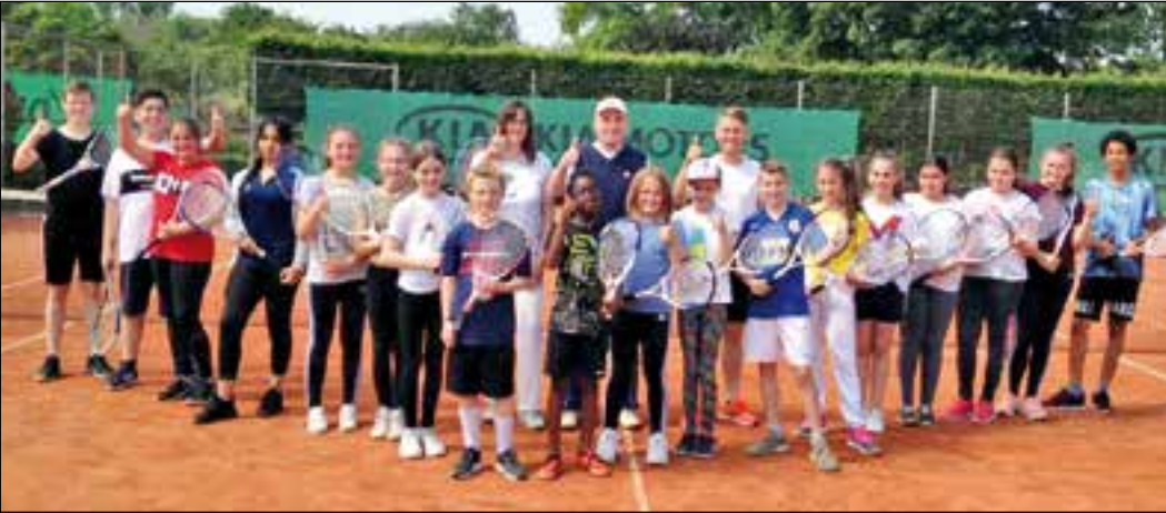
Konnten bei der Schulsofttennis-Meisterschaft in Frankfurt ihre Klasse unter Beweis stellen und Platz 2 erreichen: die Schüler der Softtennis-AG der Friedrich-Stoltze-Schule.