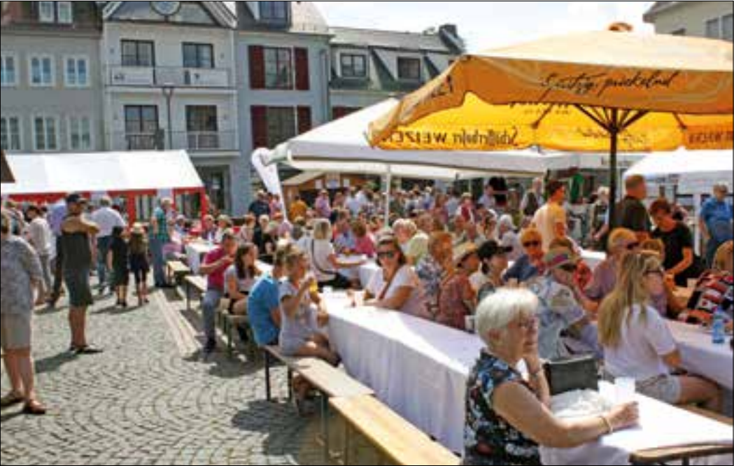
Die Vereine feierten und fast alle kamen: Obwohl es am Sonntag schon ziemlich warm geworden ist, tummelte sich reichlich Volk unter den Sonnenschirmen auf dem Fest.