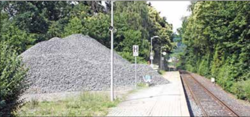
Ob hier jemand versucht hat, das Relief von Altkönig, großem und kleinem Feldberg nachzuahmen sei dahingestellt, gebraucht wird der Schotter für die aktuellen Gleisbauarbeiten, wie die Verladespuren vor der Bahnsteigkante belegen. Im Ortsbeirat ist man über das Materiallager im hinteren Bahnhofsbereich allerdings weniger erfreut...

genau an dieser Absperrung zu schaffen gemacht und sie vom Bahnsteig ins Wartehäuschen verfrachtet, wo sie eher unauffällig an der Seite stand. Prompt saßen Mutter und Tochter auf dem Bänkchen daneben, als die KöWo am Samstagmittag zum Fototermin anrückte und antworteten auf die vorsichtige Frage, ob sie hier etwa auf den Zug warten würden, freudig mit „ja“. Da sich diese Antwort aber nicht mit dem Objekt des Fotografieren vereinbaren ließ, fand man nach kurzer Suche die Wegbeschreibung zur Bushaltestelle in der Wiesbadener Straße und sogar die dortigen Abfahrtszeiten, die – warum auch immer – im eigentlich abgesperrten Bereich ausgehängt waren. Weglänge fünf Minuten, Abfahrt in zehn Minuten – der Weg in die große Stadt war gesichert. Die Idee freilich, abends dann mit der Bahn wieder heimzufahren, musste noch an Ort und Stelle verworfen werden, wie der große Schotterberg am Ende des Bahnhofes ahnen ließ, waren die Arbeiten trotz Wochenendeinsatz nicht ganz so schnell beendet.