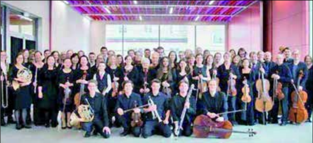
Die Junge Marburger Philharmonie, eines der führenden Hochschul-Orchester Deutschlands, gastiert beim Königsteiner Sommerkonzert.