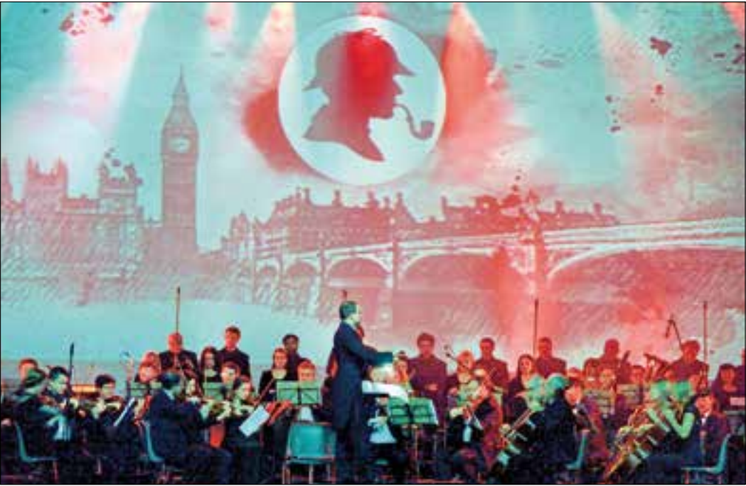
Die Besucher dürfen sich auch bei „The Music of Hans Zimmer & Others“ auf ein großes Orchester und Lichtinszenierungen freuen