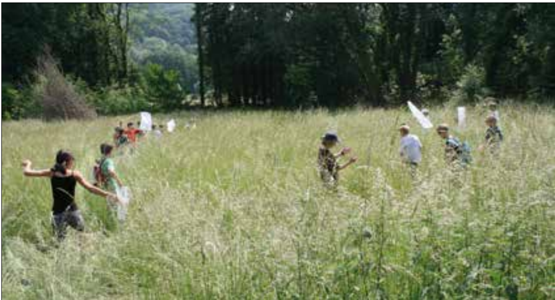
Children have lots of fun on this day in and about nature.