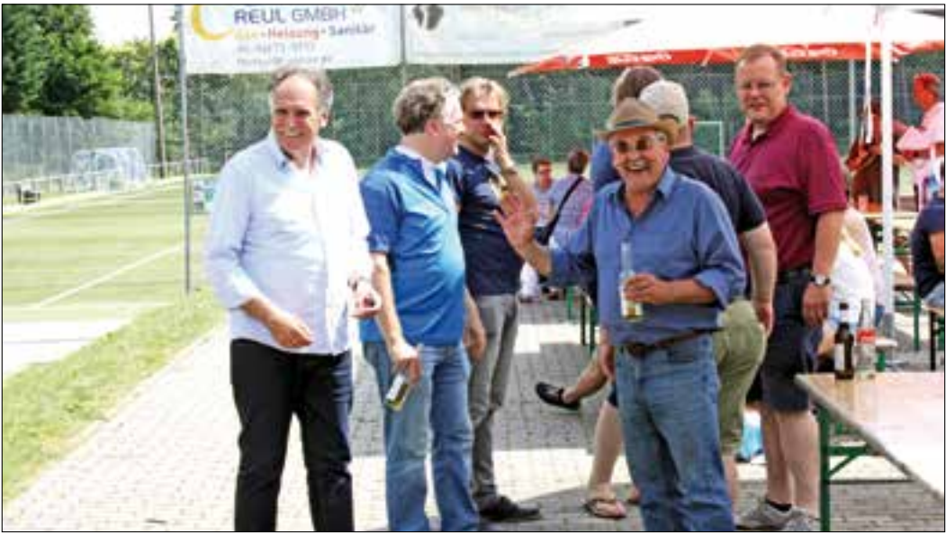
Bei gleichermaßen guter Laune wie strahlendem Sonnenschein warteten die Ehrengäste im Freien auf ihren Auftritt im schattigen Vereinsheim.