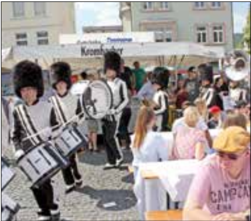
Immer wieder beachtlich: Die MuShoBa findet auch auf überfüllten Plätzen genug Raum zum Marschieren.