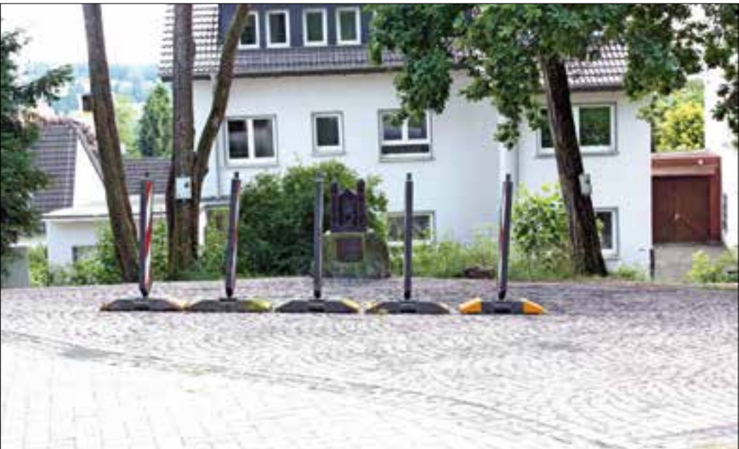
Vor dem Synagogendenkmal müssen sich die Fugen im Pflaster noch schließen, unter dem Split wird allmählich das Muster eines siebenarmigen Leuchters sichtbar.

– Weg nun hangseitig mit einem Natursteinmäuerchen abgefangen, während ein breites Bankett zur Talseite hin erst einmal genügend Abstand zur dortigen Neigung schafft. Der Gang auf dem neuen Kies ist angenehm, hoffentlich bleibt er auch bei „Starkregen“ an seinem Platz. Am östlichen Ende des Weges, also am Eingang zum Kurpark vom Seilerbahnweg aus, liegt eine Baustelle noch in den letzten Zügen, hier hat man die Einmündung der Wege vor dem bronzenen Synagogendenkmal zum Platz erweitert und gepflastert, so dass die Gäste zur Gedenkfeier im Herbst nicht mehr auf die Wiese ausweichen müssen. Noch ist das frische Pflaster gesperrt und der Split, der in die Fugen sickern soll, verdeckt zu großen Stücken, dass in die rötliche Pflasterung mit schwarzen Steinen ein siebenarmiger Leuchter eingelassen worden ist.