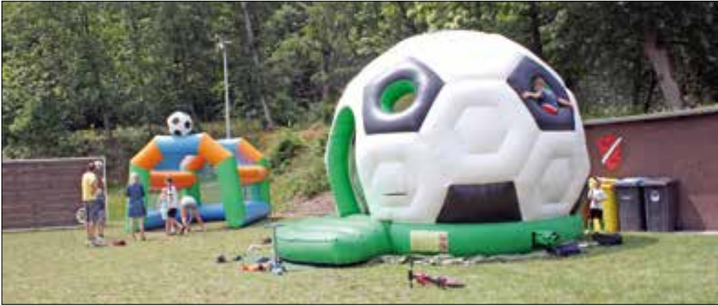
Auch auf der Spielwiese drehte sich alles um den Fußball...