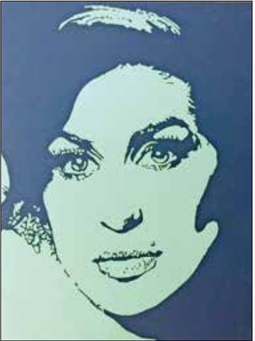
Portraitiert vom kanadischen Künstler twotone: die 2011 verstorbene englische Pop-Ikone Amy Winehouse (li.) und James-Bond-Darsteller Daniel Craig.

Königstein (kw) – Die Pop Art ist eine Kunstbewegung, die zwischen Mitte und Ende der 1950er Jahre unabhängig voneinander in England und den USA entstand, und in den 1960er Jahren zu einer vorherrschenden künstlerischen Ausdrucksform wurde. Prominenteste Protagonisten der Pop Art sind z. B. Andy Warhol, Roy Lichtenstein, Robert Indiana oder Claes Oldenburg. Die Bewegung stellte eine Herausforderung für die Traditionen der bildenden Kunst dar, weil die Motive häufig der Alltagskultur, der Welt des Konsums, den Massenmedien und der Werbung entnommen wurden. Die Darstellung erfolgte meist in fotorealistischer und überdimensionierter Abbildung. Im Jahre 2017 entstand in Königstein die Idee des „twotone-Prinzips“, das auf dem Grundgedanken der Pop Art basiert, diese aber neu und konsequent weiterentwickelt. Der Künstler twotone, der sich selbst den Namen seiner Pop-Art Richtung gegeben hat, portraitierte für diese Ausstellung mit nur zwei Farben, also twotone, Personen, die aus dem volkskulturellen Umfeld der Königsteiner Ritter stammten. Das Thema war: „Was liebst Du an deinem Wohnort?“ Die Bilder wurden unter dem Motto: „Königsteiner Ritter und ihre Edeldamen“ 2018 parallel zum 20. Ritterturnier ausgestellt.