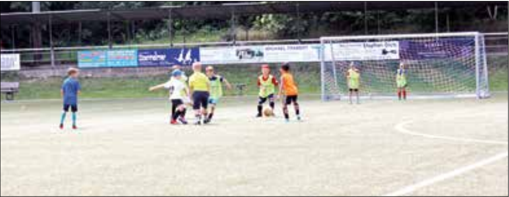
Vor der Einweihung veranstalteten die Jugendmannschaften aus Mammolshain und Schneidhain ein Turnier – zum Kennenlernen, in der kommenden Saison soll in diesem Bereich verstärkt zusammengearbeitet werden.