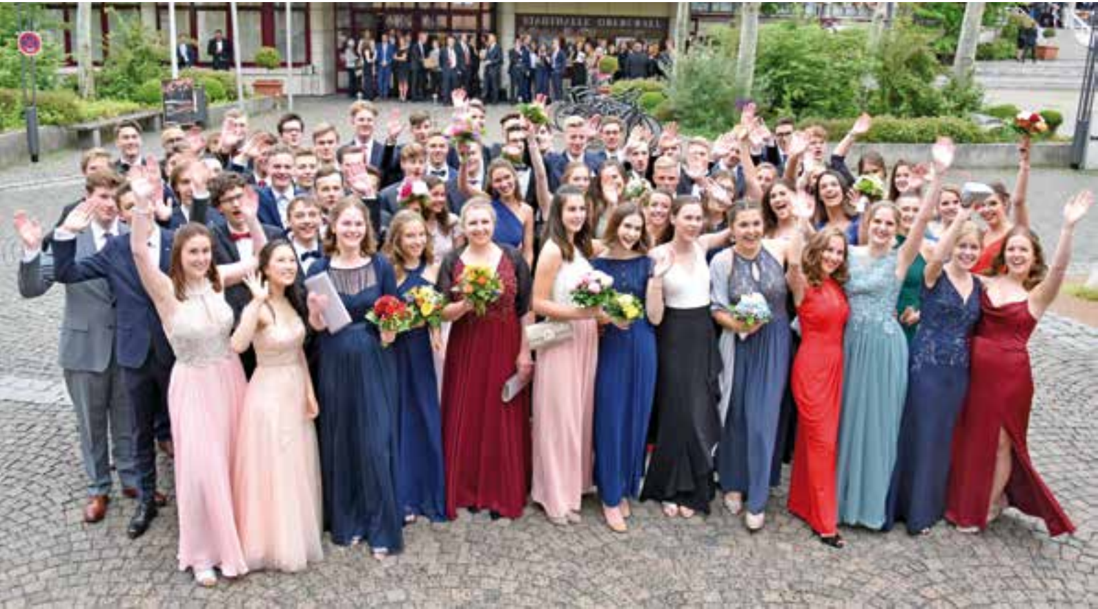
Den feierlichen Abiball haben sie sich redlich verdient, die diesjährigen Abiturienten der Bischof-Neumann-Schule. Die Schülerinnen und Schüler haben ihre allgemeine Hochschulreife mit Bravour bestanden und insgesamt mit einem Notendurchschnitt von 1,98 abgeschlossen. Alle Absolventen haben die Prüfungen erfolgreich bestanden; keiner musste die sprichwörtlichen Segel streifen.