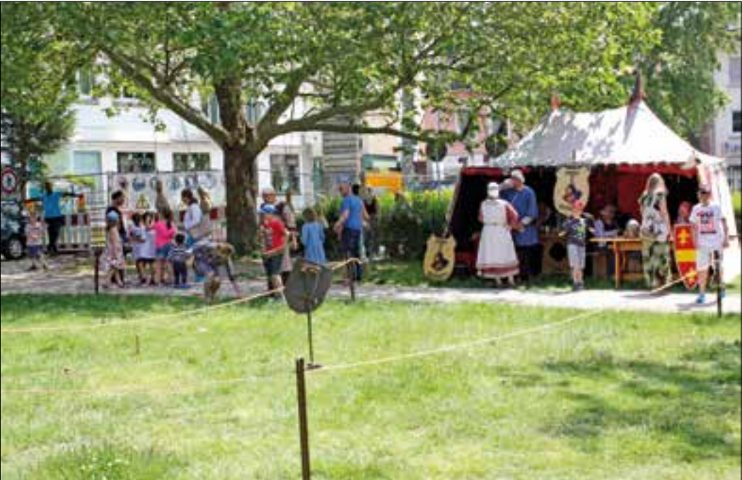
In der Konrad-Adenauer-Anlage war das Kinderprogramm im maximal möglichen Schatten angesiedelt: Hier der Ritter-Parcours zum Hufeisenwerfen.