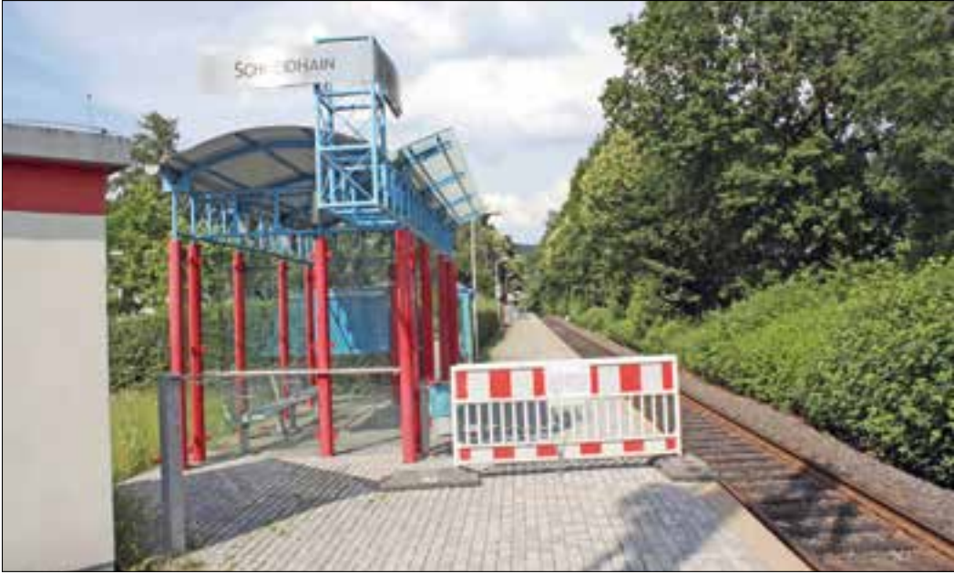
So wie am Bahnhof in Schneidhain sah es in den letzten Tagen an der ganzen Strecke aus, das Absperrgitter enthielt den Hinweis auf die eingerichtete Ersatzbus-Haltestelle. Warum die Abfahrtszeiten der Busse aber hinten am Wartehäuschen ausgehängt waren, bleibt ein Geheimnis der Hessischen Landesbahn (HLB).

Königstein/Schneidhain (hbf) – Die Zeichen verdichten sich, dass mit der Umstellung der Triebwagen der Kleinbahn von Diesel auf umweltfreundlicheren Antrieb nicht nur Ruhe für die Bahnstationen herrschen wird – auch auf dem lokalen Arbeitsmarkt wird wohl eine Beruhigung anstehen, wenn die auf Dieselfahrzeuge ausgelegte Werkstatt am Bahnhof Königstein geschlossen wird. Aktuell stehen die Zeichen in Sachen Bahnverbindung trotz einer fünftägigen Stilllegung aus baulichen Gründen aber auf „freie Fahrt“, denn wer seine Gleise saniert, der will sie auch weiterhin nutzen, hoffentlich mit steigenden Fahrgastzahlen zum Wohle der Umwelt. Wie in der KöWo angekündigt, überarbeitete die HLB rund um das vergangene Wochenende ihre Gleisanlage, weshalb Busse den Ersatzdienst für die Schienenfahrzeuge übernehmen. An den Bahnhöfen, die zweckmäßiger Weise abgesperrt waren, wiesen Schilder und Sonderfahrpläne darauf hin. In Schneidhain hatten sich allerdings unbekannte Hände