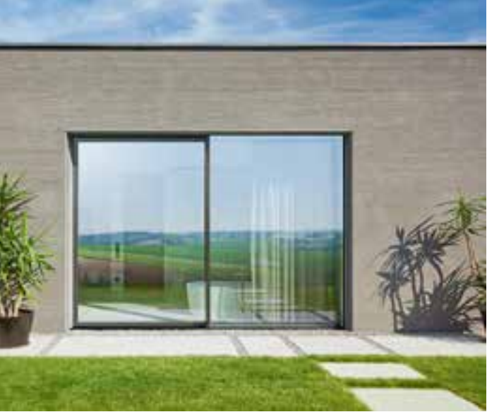
ONE by Josko ist ein reines Alu-Fenster- und Schiebetürsystem, das mit seiner absolut symmetrischen Optik und dem schlanken Rahmenmaß Qualität, Funktionalität und Design auf innovative Weise verbindet.

und an allen Seiten über ein sehr schmales Rahmenmaß von gerade einmal fünf Zentimetern verfügen. ONE by Josko präsentiert sich schlank und edel als echter Trendsetter und erzeugt an Fenstern und Türen ein harmonisches, homogenes Bild, das sich dank verschiedener Materialien und Farben problemlos jedem Wohnstil anpasst. Die Applikationen kommen wahlweise in Glas, Aluminium, Betonoptik oder diversen Holz- und Stahlarten daher. Optimal abgerundet wird das Portfolio durch extra für ONE by Josko entwickeltes Zubehör wie Griffe, Fensterbänke, Bodenschwellen, Insektenschutz und Co. Da Josko als Komplettanbieter hochwertiger Produktlinien bei Fenstern, Türen, Ganzglas-Systemen, Naturholzböden und Sonnenschutzlösungen eine Smart Mix-Philosophie ermöglicht, ist ONE by Josko auch mit allen anderen Josko Systemen perfekt kombinierbar. Mehr Infos unter www.josko.at .