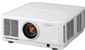
Vidéo projecteur 7000 lumens Full HD 2000 lumens