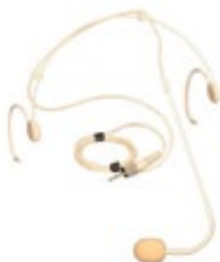
Micro Serre Tête 180€