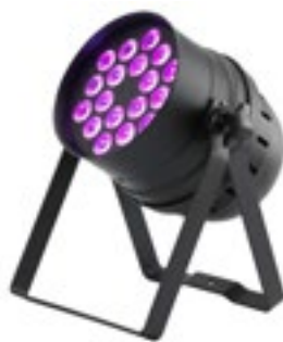
Mini Par LED à partir de 40€