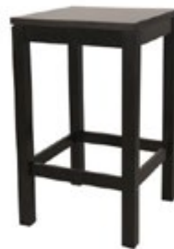
ART DECO H : 110 x P : 80 x L : 80 brun