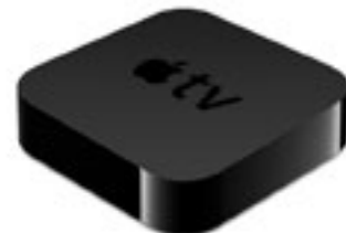
Système APPLE TV