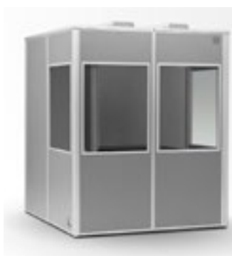
Cabine de traduction Prévoir une cabine par langue sur devis