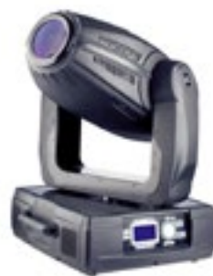
Micro col de cygne sur devis