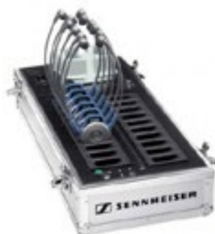
Casque de traduction Prix/casque 4,50€