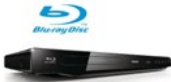
Lecteur Blu-ray Disc