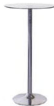
WAPA Alu H : 115 x D : 65