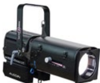
Projecteur de poursuite 110€