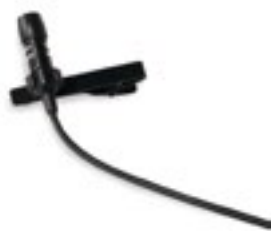
Micro cravate 150€