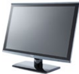
Moniteur de retour

17" 150€ 24" 180€ 32" 200€ 46" sur pieds 380€ 55" sur pieds 490€