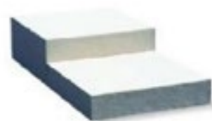
Podium réglable H : 12/40/60/80/100 P: 100 x L: 200 habillage moquette / jupage coton graté