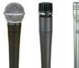
Micro SM 58 90€ 57 90€ 81 110€