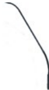
Micro col de cygne 50€