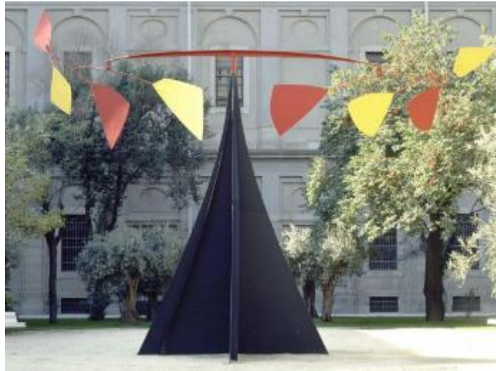
Ilustración 1 - Obra "Carmen"