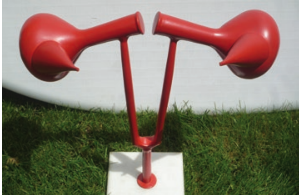
Autor: Javier Muro "Fiesta" aluminio fundido. 56x51x23 cm. 1995

Lugar / Lekua Pabellón de Mixtos de la Ciudadela de Pamplona, plantas baja y 1ª