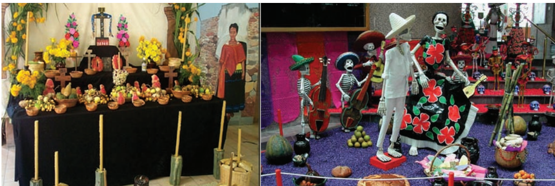
Día de Muertos. México

Pero quizá la prueba más clara de la confianza y la falta de temor a los muertos de estas tradiciones es la manera de celebrarla por algunas personas en Nicaragua: yendo a dormir esa noche al panteón, con los familiares muertos.