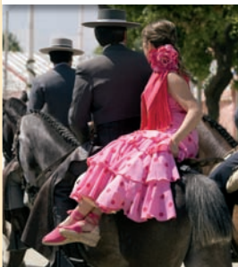
Traje de cordobés y sevillana