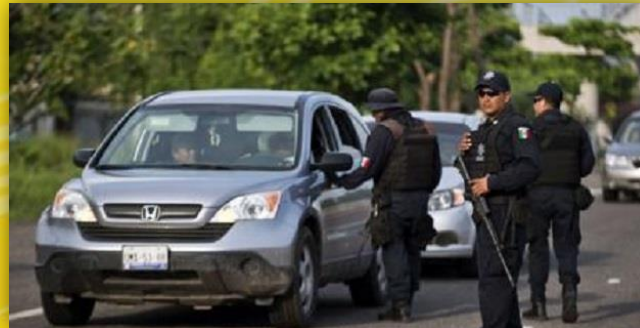
Inseguridad, violencia, narcotráfico