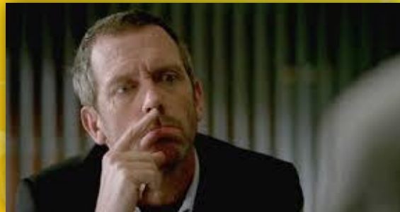
Los no creyentes