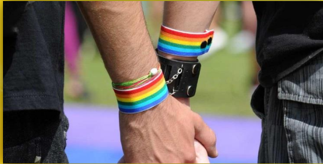
Grupos de diversidad sexual