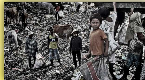
Realidad de Pobreza