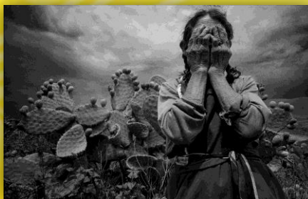
Realidad campesina e indígena