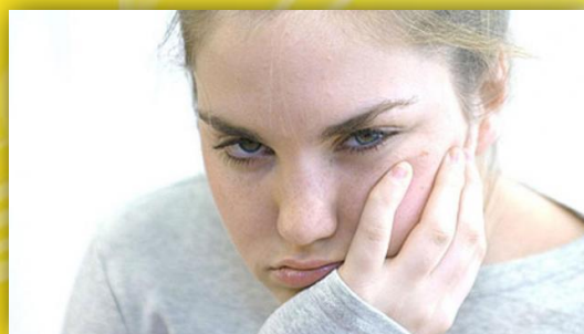
Los bautizados no Convertidos