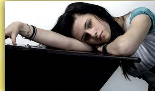
Los alejados o Indiferentes