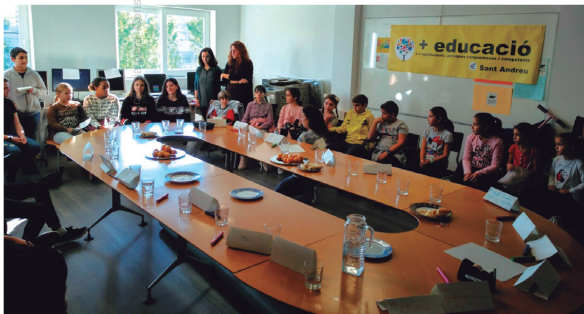
Imagen 3. Asamblea entre criaturas de diferentes centros educativos antes del confinamiento

Tenemos que poder colaborar para que el éxito de cada proyecto particular sume al éxito colectivo