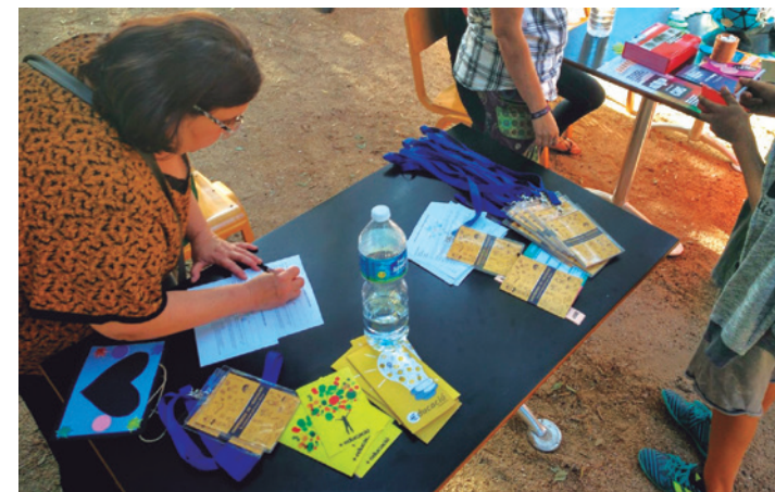
Imagen 2. Registro de criaturas en la Universidad del Tiempo Libre

Durante el confinamiento ya hemos probado alguna asamblea entre criaturas de diferentes centros educativos para compartir puntos de vista, reflexiones y propuestas por medio de videoconferencias. Escucharles y acompañarles en este proceso de construcción colectiva es básico para diseñar las propuestas con los verdaderos protagonistas. Las tecnologías nos