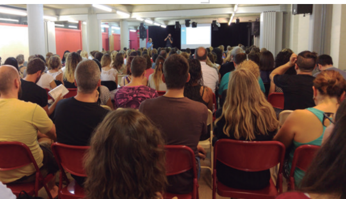
Imagen 1. Claustro de maestros y profesores de +Educació

Más del 80% de las criaturas se quedan en la escuela a la hora de comer, haciendo uso de