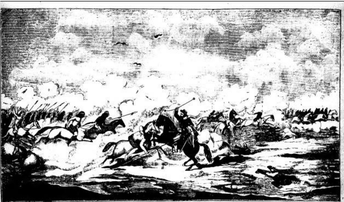
Era el hijo de un cacique — según yo lo averigué — la verdad del caso jué — que me tuve apuradazo — hasta que al fin de un balazo — del caballo lo bajé.

http://upload.wikimedia.org/wikipedia/commons/4/44/El_Gaicho_Mart%C3%ADn_Fierro_3.jpg