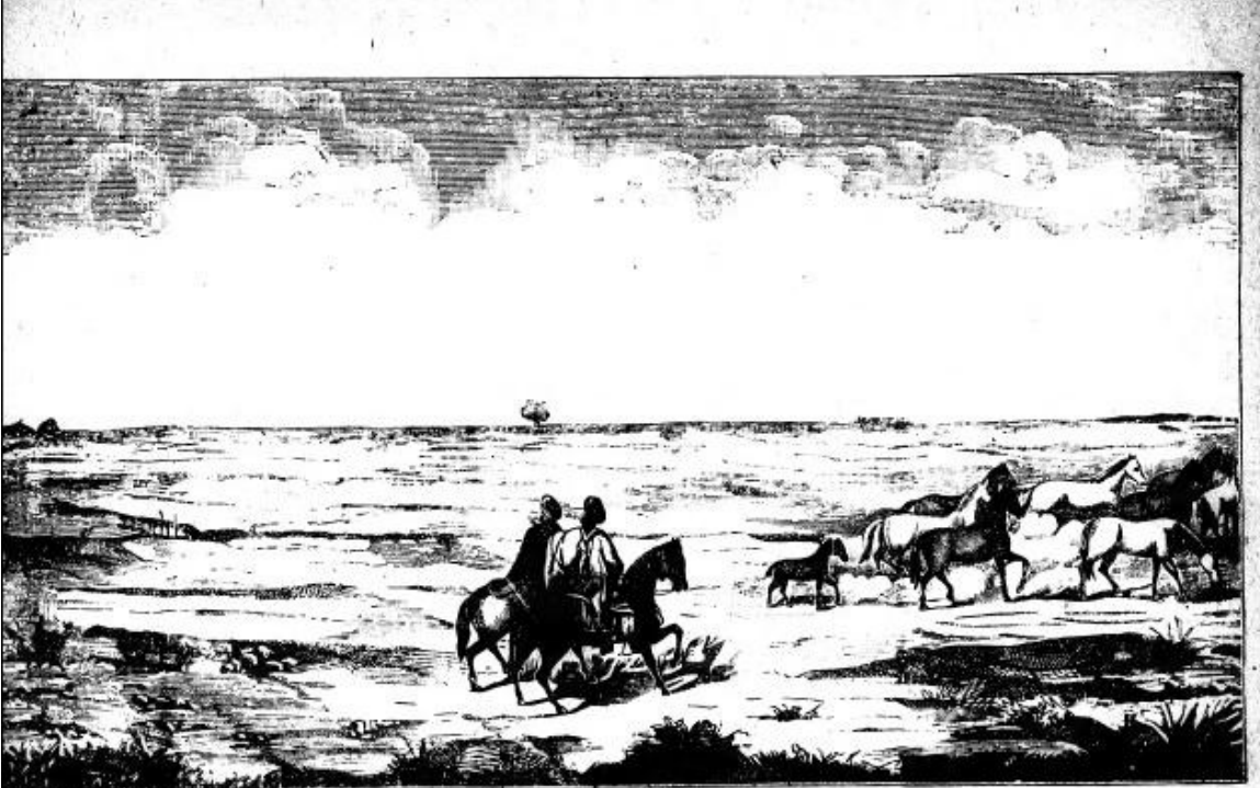
Por la frontera cruzaron — Y cuando la habían pasado, — una madrugada clara — lo dijo Cruz que mirara — las últimas poblaciones...

http://upload.wikimedia.org/wikipedia/commons/4/44/El_Gaicho_Mart%C3%ADn_Fierro_3.jpg