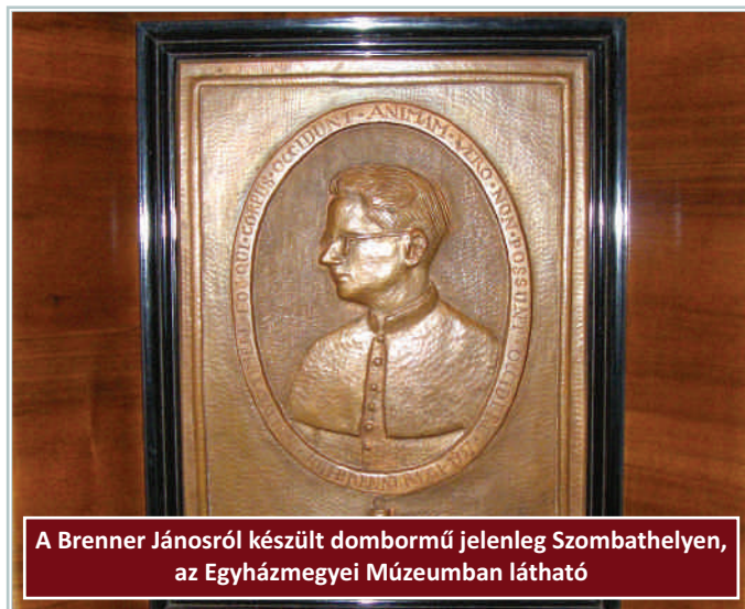
A Brenner Jánosról készült dombormű jelenleg Szombathelyen, az Egyházmegyei Múzeumban látható

A dombormű elkészült, jelenleg az Egyházmegyei Múzeumban látható. Lehet, hogy a terv egy szobor volt, mert az az ÁVO íásaiban is szerepel, hogy szobrot akarnak állítani neki a templomban. Kozma Ferenc egy Pieta szobrot készíttetett János emlékére, amit nem engedtek a felszentelt magyarlakai templomban felállítani, így jelenleg is a kethelyi temetőben látható a templom mellett. Erre utalhat a rendőrségi jelentés. Szüleim személyesen utaztak Budapestre a művészhez, és titokban hozták haza a domborművet szobájukba. A testet meg tudták ölni, de a lelket nem.