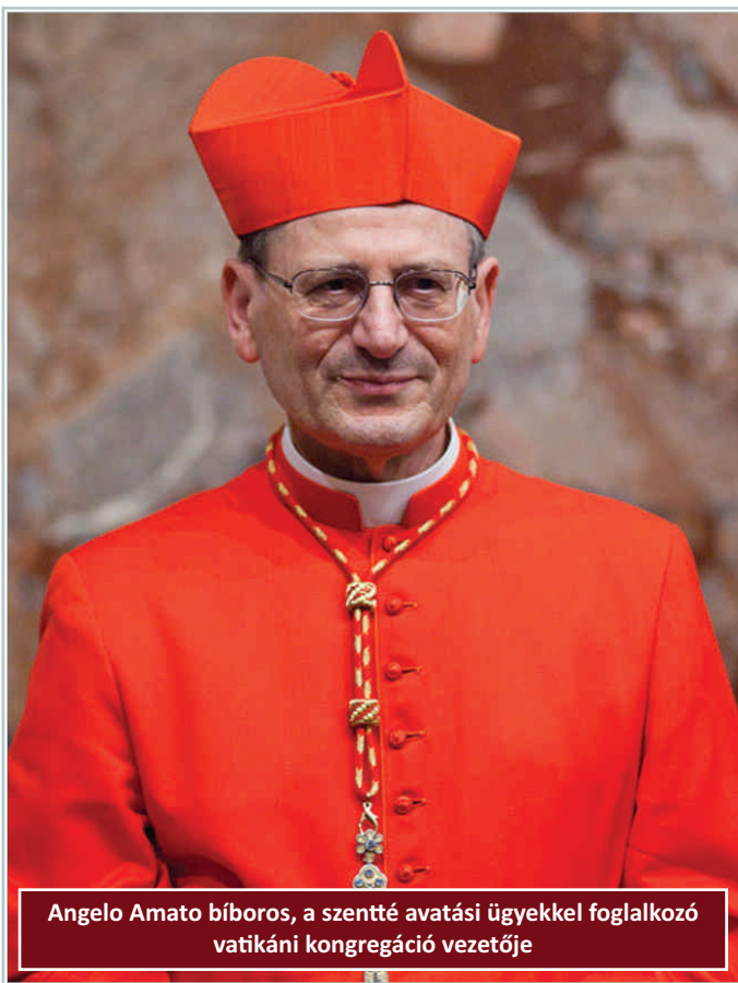
Angelo Amato bíboros, a szentté avatási ügyekkel foglalkozó vatikáni kongregáció vezetője