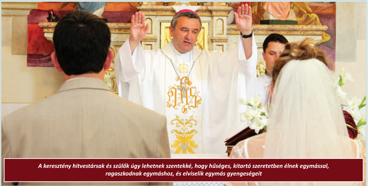
A keresztény hitvestársak és szülők úgy lehetnek szentekké, hogy hűséges, kitartó szeretetben élnek egymással, ragaszkodnak egymáshoz, és elviselik egymás gyengeségeit

A püspökök, papok és a diakónusok úgy lesznek szentekké, hogy buzgón és bátran végzik szolgálatukat, imádsággal, áldozatbemutatással és igehirdetéssel szolgálnak az Isten és az Egyház titkainak. Minden hibától megőrzik magukat, Isten kedvében járnak, és gondoskodnak az emberek üdvösségéről. „Végül pedig a rájuk bízottakat jó példával kell serkentenüük, visszatartván őket minden rossztól, és erejükhez mértén az Úr segítségével szüntelenül nemesíteniük kell erkölcsüket, hogy a rájuk bízott nyájjal együtt eljussanak az örök életre” – ahogy azt a II. Vatikáni Zsinat megfogalmazza.