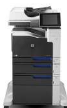
Impresora empresarial HP LaserJet 700 color MFP M775f