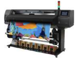
Impresora HP Latex 570