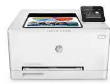
HP Color LaserJet Pro M252dw