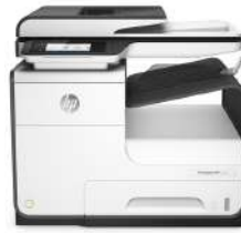
Impresora multifunción HP PageWide de la serie 377dw