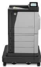
HP Color LaserJet Enterprise M651xh