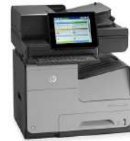
MFP (producto multifunción) HP OfficeJet Enterprise Color Flow X585z