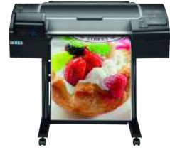
Impresora HP DesignJet Z2600 PostScript de 24 pulgadas