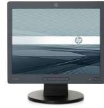
Monitor Non-Touch de 15 pulgadas HP L1506x