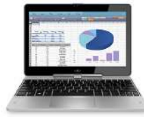
Tablet HP EliteBook Revolve 810 G3