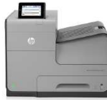
HP Officejet Enterprise Color X555dn