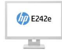
Monitor HP EliteDisplay E242 de 24 pulgadas solo con cabezal