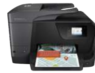
Impresora multifunción HP OfficeJet Pro 6970