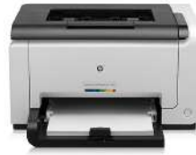
Impresora HP LaserJet Pro CP1025nw Color