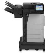
Impr. mult. HP Color LaserJet Enterprise Flow M680z