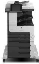
HP LaserJet Enterprise MFP M725z