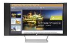
Monitor curvado de 68,6 cm (27") HP EliteDisplay S270c