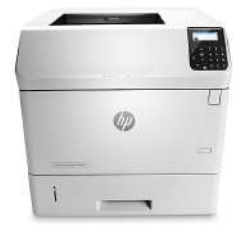
HP LaserJet Enterprise M604dn