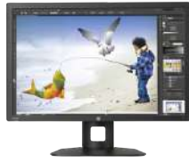
Monitor de 76,2 cm (30 pulg.) con retroiluminación LED IPS HP Z Display Z30i