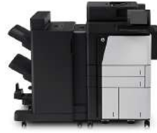
Impresora multifuncional HP LaserJet flow M830z