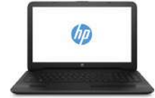
PC convertible HP x360 310 G2