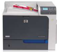
Impresora HP Color LaserJet Enterprise CP4025dn