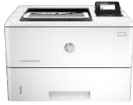
HP LaserJet Enterprise M506dn