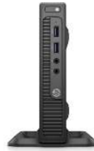
PC de escritorio mini HP EliteDesk 800 35 W G2