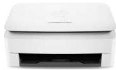
Escáner HP ScanJet Enterprise Flow 5000 s4 con alimentación de hojas