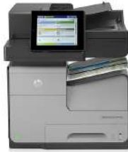
MFP (producto multifunción) HP Officejet Enterprise Color X585dn