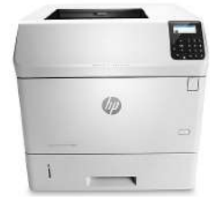
HP LaserJet Enterprise M606dn