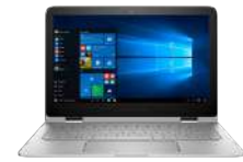
PC convertible HP Spectre Pro x360 G2