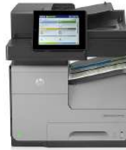
MFP (producto multifunción) HP Officejet Enterprise Color X585f