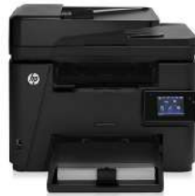
MFP (producto multifunción) HP LaserJet Pro M225dw