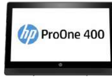
PC multifunción HP ProOne 400 G2 con pantalla no táctil de 50,8 cm (20 pulgadas)