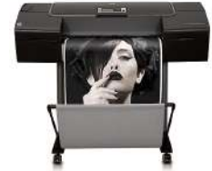
Impresora fotográfica HP Designjet Z3200ps de 610 mm