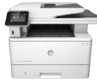
MFP (producto multifunción) HP LaserJet Pro M426fdw