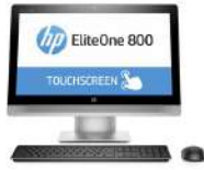
PC All-in-One HP EliteOne 800 G2 con pantalla táctil de 58,4 cm (23 pulgadas)