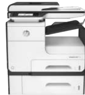
Impresora multifunción HP PageWide Enterprise Color Flow 586z