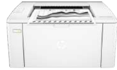
Impresora HP LaserJet Pro P1102w