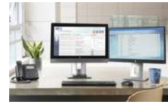
PC All-in-One HP EliteOne 800 G2 con pantalla no táctil de 58,4 cm (23 pulgadas)