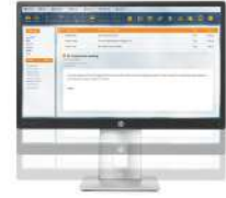
Monitor HP EliteDisplay E240 de 60,45 cm (23,8 pulgadas)