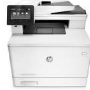
Impresora multifuncional HP Color LaserJet Pro M477fnw