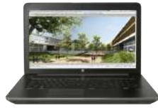
Estación de trabajo móvil HP ZBook 17 G3