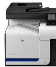
Impresora multifunción HP LaserJet Pro 500 color M570dn