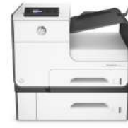
Impresora multifunción HP PageWide Pro 477dw