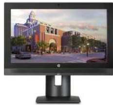
Estación de trabajo HP Z1 G3