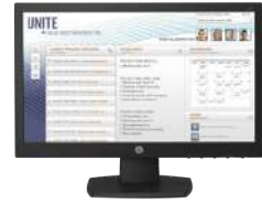
Monitor HP V197 47 cm (18,5 pulgadas)