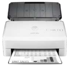
Escáner con alimentador de hojas HP ScanJet Pro 3000 s3