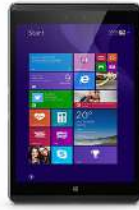
HP Pro Tablet 608 G1