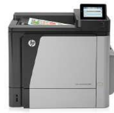
HP Color LaserJet Enterprise M651n