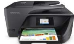
Impresora multifunción HP OfficeJet Pro 6960