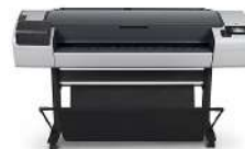
ePrinter HP Designjet T795 1118 mm A1/610mm