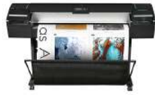
Impresora HP Designjet Z5200 PostScript de 1.118 mm