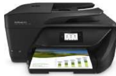
Impresora multifunción OfficeJet 6950