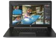
Estación de trabajo portátil HP ZBook Studio G3