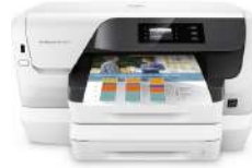
Impresora HP OfficeJet Pro 8218