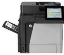
Impresora multifunción HP LaserJet Enterprise M630dn