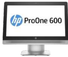
PC HP ProOne 600 G2 All-in-One no táctil de 21,5 pulgadas