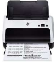
Escáner HP Scanjet Pro 3000 s2 con alimentación de hojas