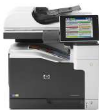
Impresora empresarial HP LaserJet 700 color MFP M775dn