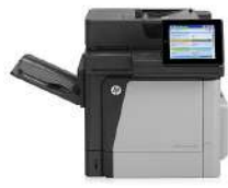
Impr. mult. HP Color LaserJet Enterprise M680dn