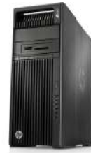
Estación de trabajo HP Z640