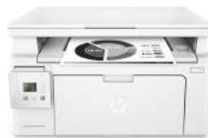
Impresora multifunción HP LaserJet Pro M130a