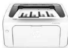
HP LaserJet Pro M12w