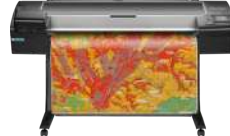
Impresora HP DesignJet Z5600 PostScript de 44 pulgadas