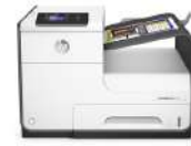
HP PageWide Enterprise Color 556dn