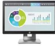
Monitor HP EliteDisplay E202 de 50,8 cm (20 pulgadas)