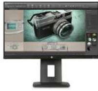
Pantalla HP Z23n IPS de 58,4 cm (23 pulgadas)