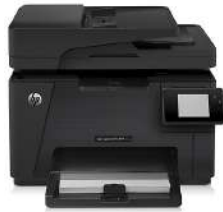
Multifuncional HP Color LaserJet Pro M177fw