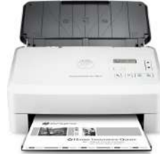
Escáner HP ScanJet Enterprise Flow 7000 s3 con alimentación de hojas