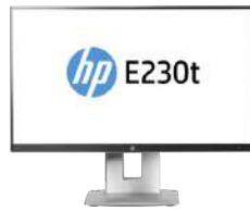
Monitor táctil HP EliteDisplay E230t de 58.42 cm (23 pulg.)