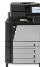
Impresora multifunción HP Color LaserJet Enterprise Flow M880z