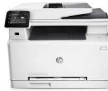
HP Color LaserJet Pro MFP M277dw