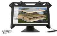
Pantalla de realidad virtual HP Zvr de 59,94 cm (23,6 pulgadas)