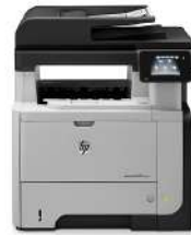
Impresora multifunción HP LaserJet Pro M521dn