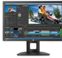
Monitor LED retroiluminado IPS HP Z Display Z24i de 61 cm (24")