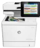
Multifunción HP Color LaserJet Enterprise M577dn