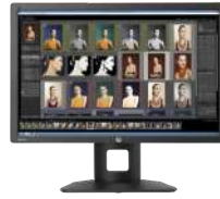
Pantalla HP DreamColor Z24x