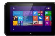
HP Elite x3