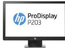
Monitor HP ProDisplay P203 de 50,8 cm (20")