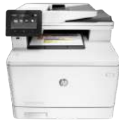
Impresora multifuncional HP Color LaserJet Pro M477fdw