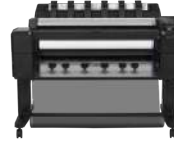
Impresora multifunción HP DesignJet T2530 de 36 pulgadas