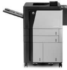
Impresora HP LaserJet Enterprise M806x+