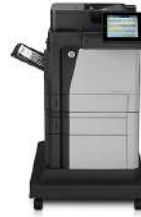
Impresora multifunción HP LaserJet Enterprise M630f