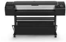
HP Designjet Z5400 1118 mm PostScript ePrinter