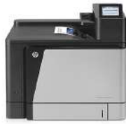
Impresora HP Color LaserJet Enterprise M855dn