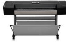
HP DesignJet Z3200 1118-mm PostScript Photo Printer