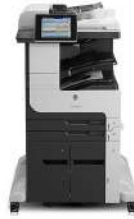
HP LaserJet Enterprise MFP M725z+