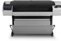
Impresora multifunción HP DesignJet T830 de 36 pulgadas