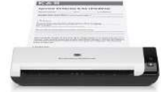
Escáner móvil HP Scanjet Professional 1000