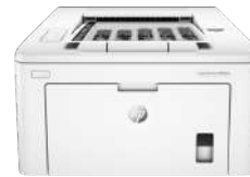
HP LaserJet Pro M201dw