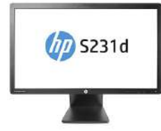
Monitor de puerto para ordenador portátil BLU LED IPS HP EliteDisplay S231d de 58,4 cm (23 pulgadas)