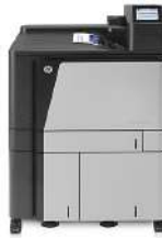
Impresora HP Color LaserJet Enterprise M855x+