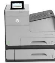
HP Officejet Enterprise Color X555xh