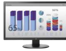
Monitor HP V243 de 24 pulgadas