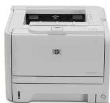
Impresora HP LaserJet P2035