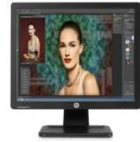
Monitor portátil USB HP EliteDisplay S140u de 35,56 cm (14 pulgadas)