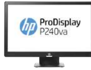
Monitor HP ProDisplay P240va de 60,45 cm (23,8 pulgadas)