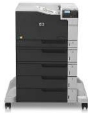
HP Color LaserJet Enterprise M750xh