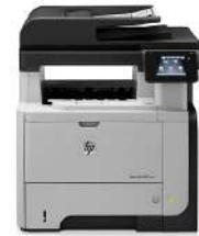
Impresora multifunción HP LaserJet Pro M521dw