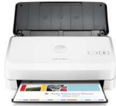
Escáner HP Scanjet Pro 2000 s1 con alimentador de hojas