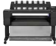
Impresora HP DesignJet T930 PostScript de 36 pulgadas con disco duro cifrado