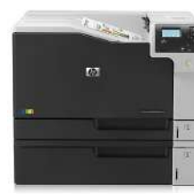
HP Color LaserJet Enterprise M750n