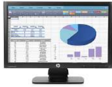
Monitor HP ProDisplay P202 de 50,8 cm (20")