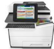
Impresora multifunción HP PageWide Enterprise Color 586dn