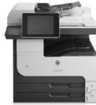
HP LaserJet Enterprise MFP M725dn