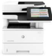
Producto multifunción HP LaserJet Enterprise M527dn