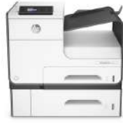
Impresora y bandeja HP PageWide Pro 452dwt