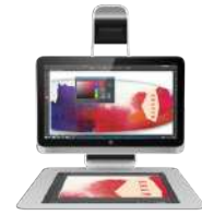
Sprout Pro by HP