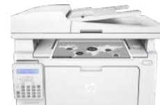
Impresora multifunción HP LaserJet Pro M130fn