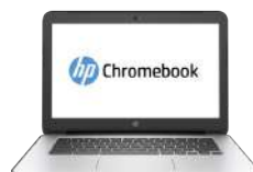
HP Chromebook 11 G4