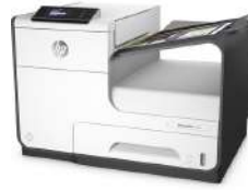
Impresora HP PageWide 352dw