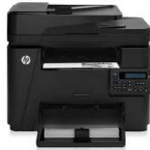
MFP (producto multifunción) HP LaserJet Pro M225dn