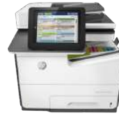
Impresora multifunción HP PageWide Enterprise Color 586dn