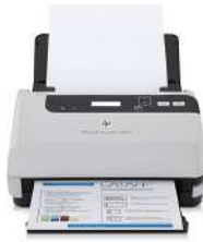
Escáner HP Scanjet Enterprise Flow 7000 s2 con alimentación de hojas