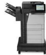
Impresora multifunción HP LaserJet Enterprise Flow M630z