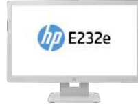
Monitor HP EliteDisplay E232e de 58,4 cm (23 pulgadas) (ENERGY STAR)