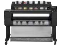
Impresora HP DesignJet T1530 PostScript de 36 pulgadas