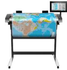
Escáner HP HD Pro de 1.067 mm