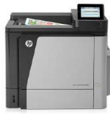
HP Color LaserJet Enterprise M651dn