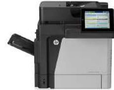
Impresora multifunción HP LaserJet Enterprise M630h