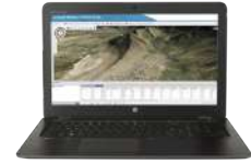
Estación de trabajo móvil HP ZBook 15u G3