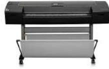
Impresora fotográfica HP Designjet Z2100 de 1118 mm