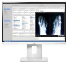
HP HC240 24-inch Healthcare Edition Display