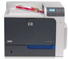
Impresora HP Color LaserJet Enterprise CP4025n