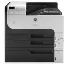
Impresora HP LaserJet Enterprise 700 M712xh