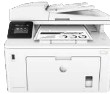
Impresora multifunción HP LaserJet Pro M227fdw