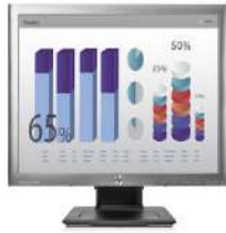
Monitor IPS HP EliteDisplay E190i con retroiluminación LED de 58,4 cm (18,9") 5:4