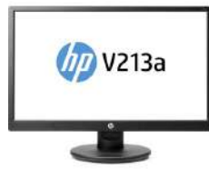
Monitor HP V213a de 52,57 cm (20,7 pulg.)