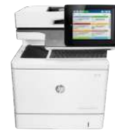
Multifunción HP Color LaserJet Enterprise Flow M577c