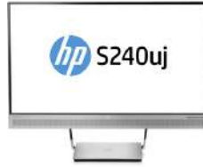
Monitor de carga inalámbrica USB-C de HP EliteDisplay S240uj 60,45 cm (23,8 pulgadas)