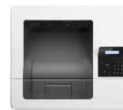
HP LaserJet Pro M501dn