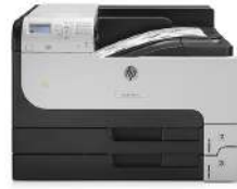
Impresora HP LaserJet Enterprise 700 M712dn