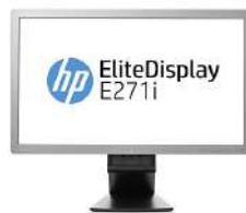
Monitor con retroiluminación LED HP EliteDisplay E271i de 27 pulgadas