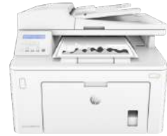
Impresora multifunción HP LaserJet Pro M227sdn