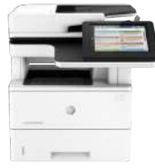
Producto multifunción HP LaserJet Enterprise M527f