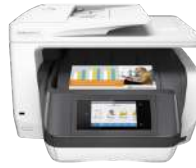
Impresora multifunción HP OfficeJet Pro 8725