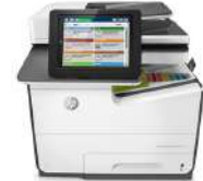
Impresora multifunción HP PageWide Enterprise Color 586f