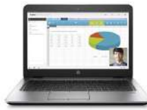
HP mt42 Mobile Thin Client