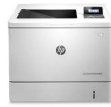
HP Color LaserJet Enterprise M553dn