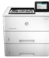
HP LaserJet Enterprise M506x