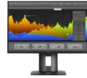
Pantalla IPS de bisel estrecho de 60,45 cm (23,8 pulgadas) HP Z24nf