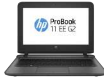
HP ProBook 11 EE G2