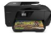
Impresora All-in-One HP OfficeJet Pro 8710