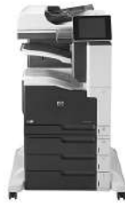
Impresora empresarial HP LaserJet 700 color MFP M775z+