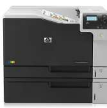
HP Color LaserJet Enterprise M750dn