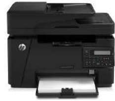
Impresora HP LaserJet Pro MFP M127fn