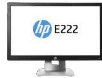
Monitor HP EliteDisplay E222 de 54,6 cm (21,5 pulgadas)