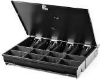
Caja de resistencia estándar HP con tapa con cierre