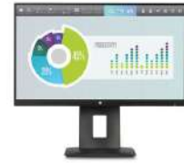
Pantalla HP Z22n IPS de 54,6 cm (21,5 pulgadas)