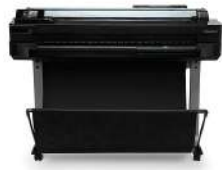
ePrinter HP Designjet T520 A0/914mm