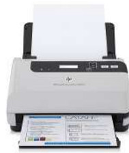
Escáner HP ScanJet Enterprise Flow 7000 s2 con alimentación de hojas