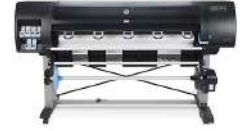
Impresora de producción fotográfica HP DesignJet Z6800 de 1524 mm