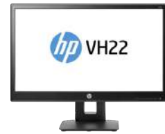
Monitor HP VH22 de 55 cm (21,5")