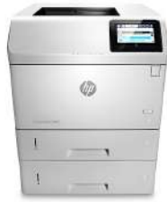
HP LaserJet Enterprise M606x