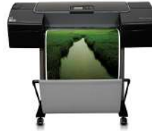
Impresora fotográfica HP Designjet Z2100 de 610 mm