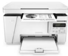
Impresora multifunción HP LaserJet Pro M26nw