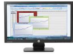
Monitor HP ProDisplay P222va de 54,6 cm (21,5")