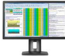
Pantalla HP Z27q 5K IPS de 68,6 cm (27")