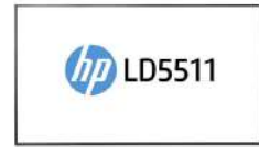
Pantalla de gran formato de HP LD5511 de 139 cm (55")