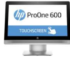
PC multifunción HP ProOne 600 G2 con pantalla táctil de 54,61 cm (21,5 pulgadas)