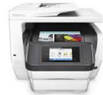
Impresora All-in-One HP OfficeJet Pro 8740