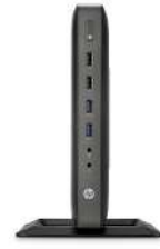
HP t620 Flexible Thin Client