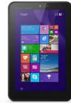
Tablet HP Pro 408 G1