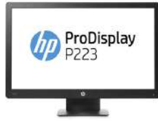
Pantalla HP ProDisplay P223 de 54,6 cm (21,5")