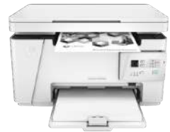
Impresora multifunción HP LaserJet Pro M130fw