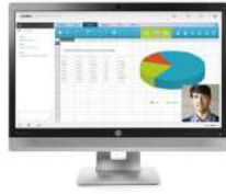
Monitor de videoconferencia HP EliteDisplay E240c de 60,45 cm (23,8")