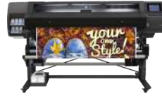
Impresora HP Latex 560