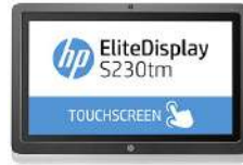
Monitor táctil HP EliteDisplay S230tm de 23 pulgadas