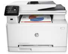
HP Color LaserJet Pro MFP M277n