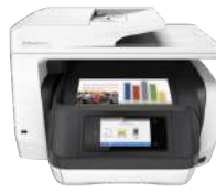
Impresora All-in-One HP OfficeJet Pro 8720