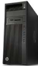
Estación de trabajo HP Z440