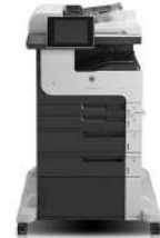
HP LaserJet Enterprise MFP M725f