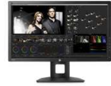
Pantalla HP DreamColor Z27x Studio