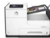
HP PageWide Enterprise Color 556dn