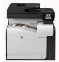
Impresora multifunción HP LaserJet Pro 500 color M570dw