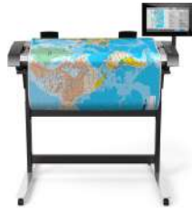
Escáner HP SD Pro de 1.118 mm