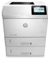
HP LaserJet Enterprise M605x