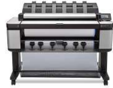
Impresora multifunción de producción HP Designjet T3500 con conexión web de 914 mm