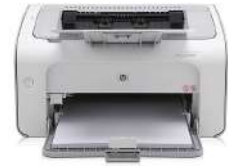
HP LaserJet Pro M501n