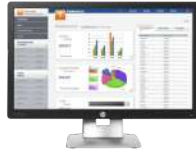
Monitor HP EliteDisplay E232 de 58,4 cm (23 pulgadas)