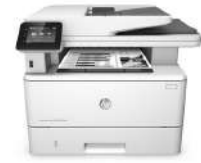
Impresora multifuncional HP LaserJet Pro M426dw