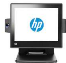
Sistema para minoristas HP RP7, modelo 7800