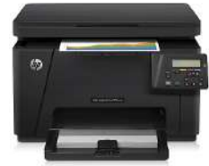
HP Color LaserJet Pro MFP M176n