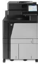
Impresora multifunción HP Color LaserJet Enterprise Flow M880z+