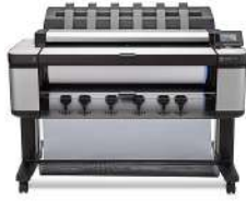
Impresora multifunción de producción HP Designjet T3500 con conexión web de 914 mm