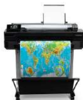
ePrinter HP Designjet T520 A1/610mm