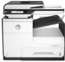
Impresora multifunción HP PageWide de la serie 377dw