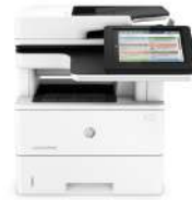
Impresora multifunción HP LaserJet Enterprise Flow M527c