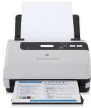
Escáner HP Scanjet Enterprise Flow 7000 s2 con alimentación de hojas