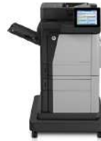
Impr. mult. HP Color LaserJet Enterprise M680f