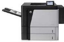
Impresora HP LaserJet Enterprise M806dn