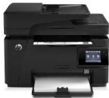
Impresora HP LaserJet Pro MFP M127fw