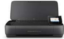
Impresora multifunción portátil HP OfficeJet 250