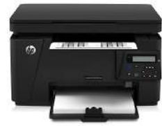
HP LaserJet Pro MFP M125nw