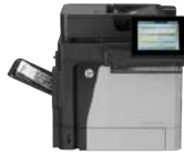
Impresora multifunción HP LaserJet Enterprise Flow M630h