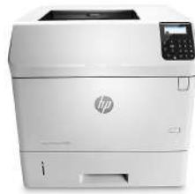
HP LaserJet Enterprise M605dn