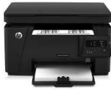
Impresora multifunción HP LaserJet Pro M125a