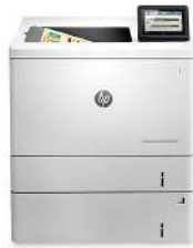
HP Color LaserJet Enterprise M553x