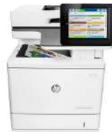
Multifunción HP Color LaserJet Enterprise M577f