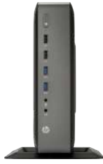
HP t620 PLUS Flexible Thin Client