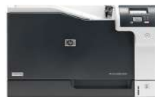
Impresora HP Color LaserJet Professional CP5225dn