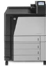
Impresora HP Color LaserJet Enterprise M855xh