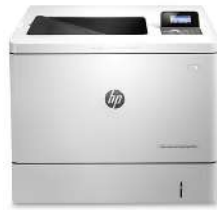
HP Color LaserJet Enterprise M552dn