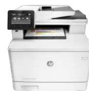
MFP (producto multifunción) HP Color LaserJet Pro M274n