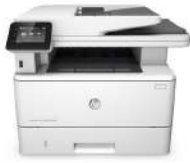
MFP (producto multifunción) HP LaserJet Pro M426fdn