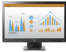
Monitor HP ProDisplay P232 de 58,4 cm (23")