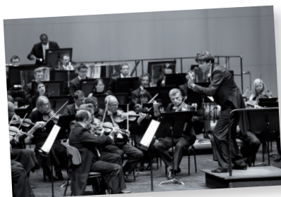
Orchestre symphonique de Mulhouse