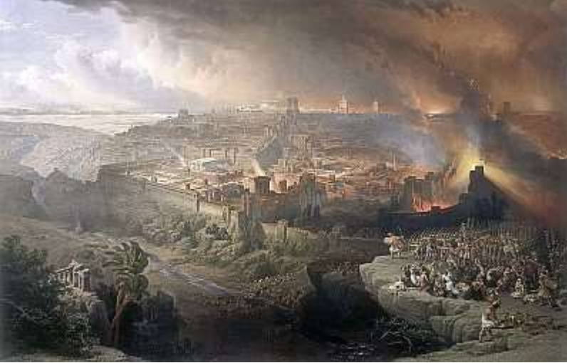
The Siege and Destruction of Jerusalem by the Romans Under the Command of Titus, by David Roberts

With no Temple in Jerusalem, the Jewish people now worship the God of Israel in their local community synagogues and in the study of Torah. Instead of offering animal sacrifices, they now offer Tefillah (prayer), Teshuvah (repentance), and Tzedakah (charity). Many think that animal sacrifices have been done away with forever , but according to Bible prophecy, this simply isn't so. The Lord tells the Prophet Ezekiel that in a future Temple, the prescribed sacrifices will be offered: “The north and south rooms facing the temple courtyard are the priests’ rooms, where the priests who approach the Lord will eat the most holy offerings. There they will put the most holy offerings, the grain offerings, the sin offerings and the guilt offerings, for the place is holy.” (Ezekiel 42:13)