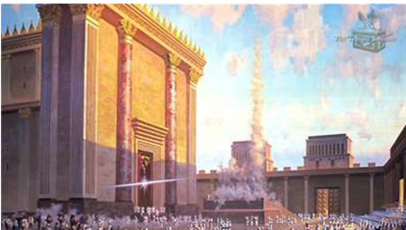
A 3D rendering of the Third Temple, by the Temple Institute

Not only are the exiles of Israel returning to the Promised Land, but preparations to build the Third Temple are progressing through the efforts of the Temple Institute and the Temple Mount Faithful Movement.