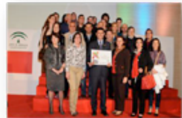
Autoridades, directores/as de colegios e IES, presidentas de AMPAS y técnicos municipales recogiendo el Premio Educaciudad

Nuestra ciudad se entiende como un conjunto de agentes educativos, corresponsables e interrelacionados, en la que el Ayuntamiento coordina a cada uno para mejorar la educación, y especialmente de aquellos colectivos en dificultad de riesgo de educación social. Coín es hoy día un ejemplo de ciudad comprometida con la educación, como garantía de un futuro de éxito, de una ciudadanía emocionalmente inteligente, ética, solidaria, competente en habilidades sociales y cohesionada frente a los factores de riesgo de la sociedad.