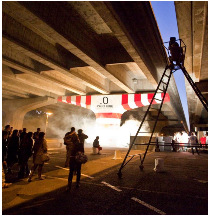
Projet Point Zéro, marquage urbain de l'ANPU, à Tours