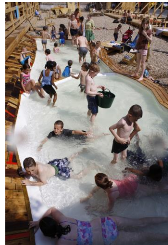
The Reunion / London 2012

EXYZT Né en 2003 à l'initiative de cinq architectes, EXYZT constitue aujourd'hui une plateforme de création pluridisciplinaire regroupant une vingtaine de personnes : architectes, graphistes, vidéastes, photographes, dj, botanistes, constructeurs. Chaque intervention du collectif s'inscrit dans une temporalité et dans un territoire déterminé, prenant souvent la forme d'installation temporaire. Les projets d'EXYZT partent de la spécificité du site, le contexte devenant support pour le projet. En fonction des projets, EXYZT mobilise tout ou partie de ses membres et tisse de nouveaux liens avec les acteurs sur place, formant ainsi des communautés d'action, des cadres de vie et d'échange. Des installations temporaires, toujours auto-construites (souvent en échafaudage et en bois) et habitée par le collectif même, reposent des questions quant aux contextes, le lieu et son usage. « Action, vie et échange » semblent les trois mots clés pour aborder l'approche du collectif. Concevoir une architecture à travers l'action ou des actions, charger l'architecture de la vie, d'usages multiples et divers et utiliser l'architecture même comme médium afin de promouvoir des rencontres et de l'échange. « L'ensemble des projets incite le visiteur à quitter une attitude purement contemplative pour devenir, lui aussi, un usager, acteur, parti prenant dans le projet ».