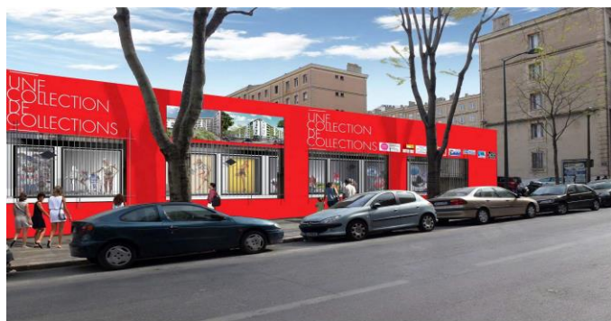
Illustration 1 et 1- Fondation Logirem / Projet "collection des collections"