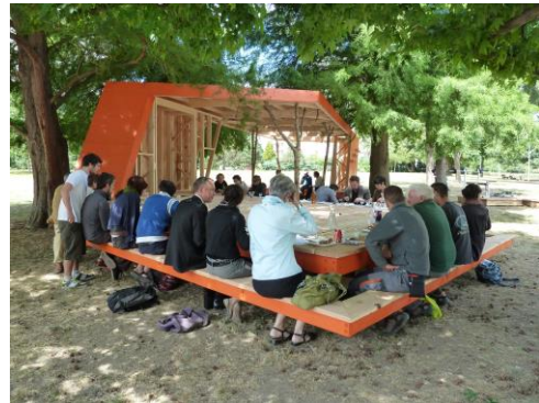
Projet « Le Brasero », Bordeaux, 2011

BRUIT DU FRIGO est un hybride entre bureau d'étude urbain et collectif de création. La structure se consacre à l'étude et l'action sur la ville et le territoire habité, à travers des démarches participatives, artistiques et culturelles. Les projets proposent des façons alternatives d'imaginer et de fabriquer notre cadre de vie, à petite et à grande échelle, à partir d'une immersion concrète dans le réel et une attention particulière aux populations et aux pratiques quotidiennes. L'Atelier d'urbanisme utopique par exemple agit comme une fabrique d'imaginaires urbains. Cette démarche est une force de proposition en matière d'aménagements urbains dont la collectivité peut se ressaisir et qui cherche in fine à construire des dynamiques de coproduction avec les décideurs et les professionnels. Bruit du Frigo agit aux côtés d'acteurs, d'artistes et d'auteurs qui proposent, au travers de leurs actions et de recherches, une redistribution des rôles et du pouvoir entre maîtrise d'ouvrage, maîtrise d'œuvre et maîtrise d'usage. Ils expérimentent et accompagnent des modes de coopération avec les usagers tout en mettant en œuvre des méthodes de collaboration avec les opérateurs publics et techniques de la transformation urbaine. En effet, coproduire démocratiquement l'espace passe par des démarches favorisant l'énoncé de visions multiples par une diversité d'auteurs.