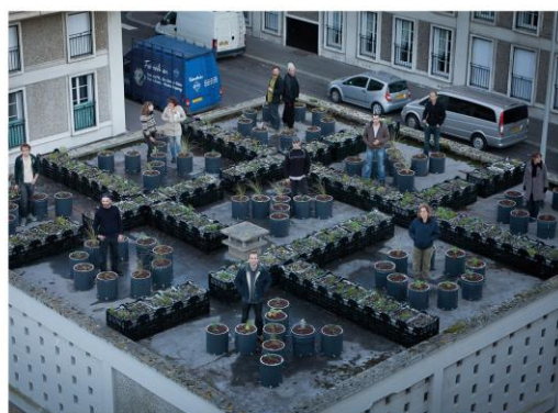
Vue aérienne d'un des toits terrasse aménagés par les Voleurs de Roses

www.edls-hlm.fr/edls/les-voleurs-de-roses-a-lassaut-des-toits