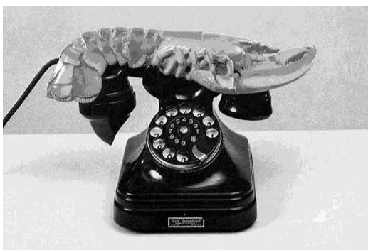
Le téléphone homard Salvador Dalí , 1936

Par association ou détournement, les objets vont donner forme à notre imagination