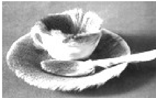
Déjeuner de fourrure, Meret Oppenheim , 1936

Là encore, les surréalistes reprennent la démarche de Lautréamont qui associait une machine à coudre et un parapluie sur une table de dissection. L'objet est d'autant plus poétique et a d'autant plus de puissance émotive que les rapports entre les éléments assemblés sont plus lointains. Dali pose un homard sur un téléphone, Brauner transforme une table en loup.