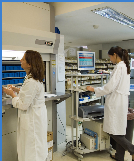
Nº de plazas de Farmacia Hospitalaria

La Farmacia Hospitalaria ha incorporado las nuevas tecnologías en todas sus áreas de trabajo, como los sistemas automatizados de almacenamiento y dispensación, la prescripción y validación electrónica, los métodos automatizados de análisis de fármacos, la guía farmacoterapéutica online (intranet), los boletines electrónicos de información de medicamentos y las herramientas de comunicación 2.0 (blogs, twitter, etc.).