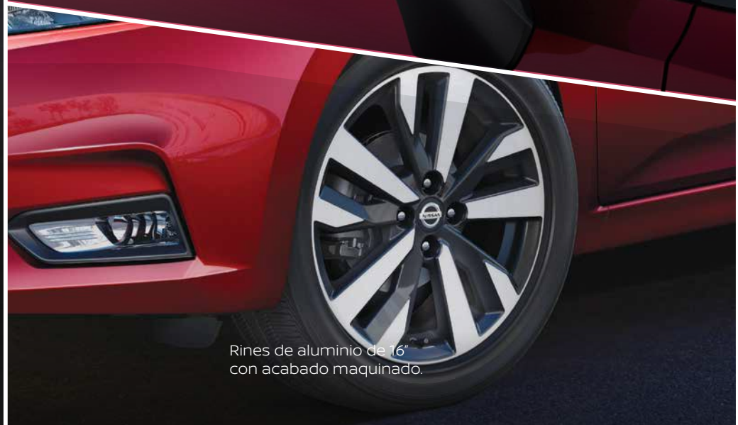
Rines de aluminio de 16" con acabado maquinado.