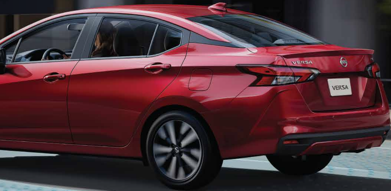
Imagen del vehículo corresponde a la versión Nissan Versa Advance y es referencial para uso publicitario, especificaciones y precios pueden variar sin previo aviso. Accesorios son opcionales y se facturan por separado. Aplican restricciones.