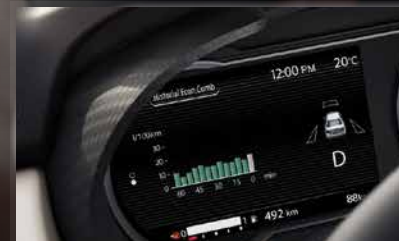
Rendimiento de combustible

Nissan Advance Drive-Assist® Display de 7" te permite personalizar el panel de instrumentos y tener a la vista toda la información que necesitas sobre tu conducción, como: rendimiento de combustible, navegación, playlist, o mantenerlo como tacómetro digital.