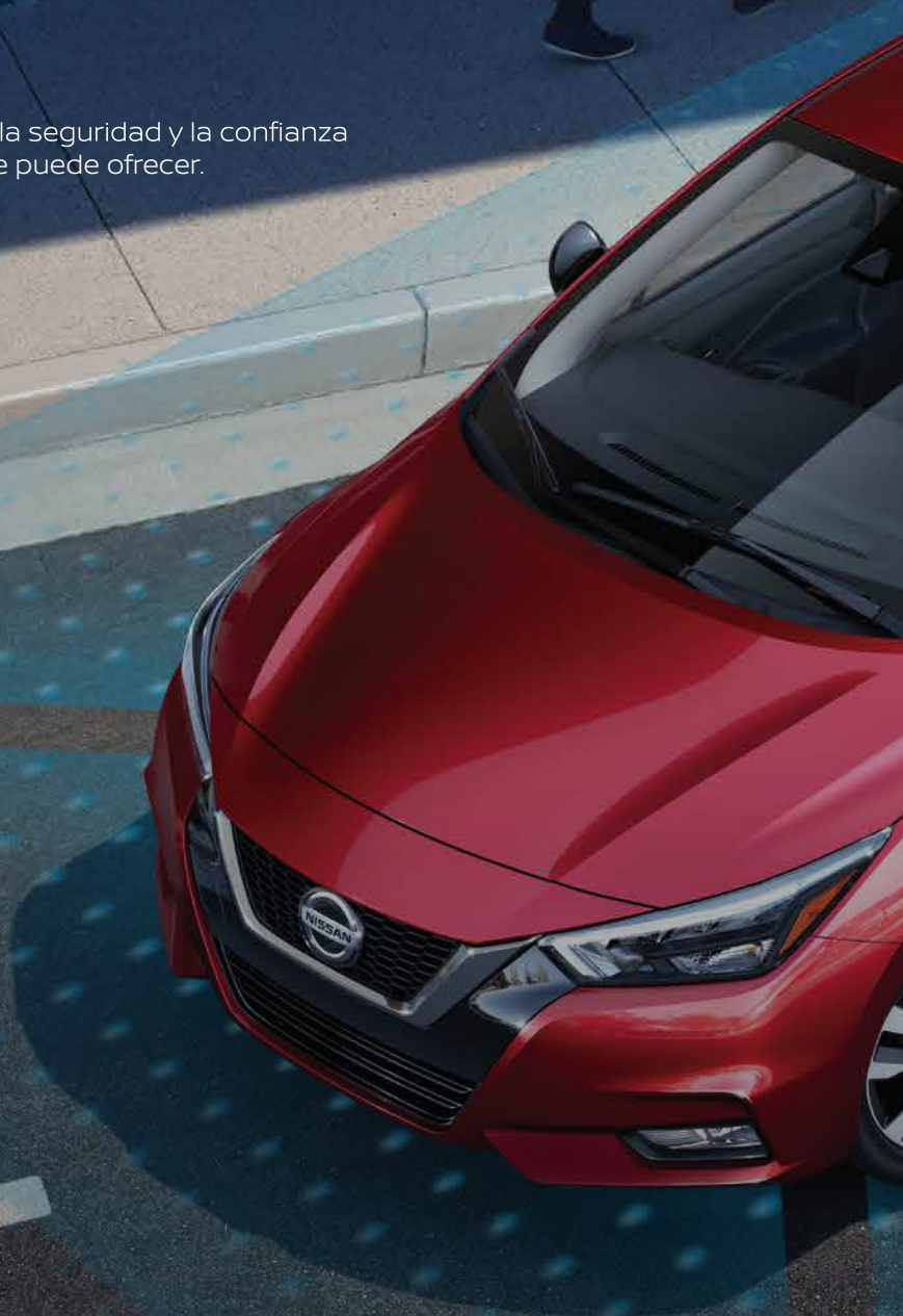
Imagen del vehículo corresponde a la versión Nissan Versa Advance y es referencial para uso publicitario, especificaciones y precios pueden variar sin previo aviso. Accesorios son opcionales y se facturan por separado. Aplican restricciones.

Vive una nueva experiencia de conducción con toda la seguridad y la confianza que solo la tecnología de Nissan Intelligent Mobility te puede ofrecer.