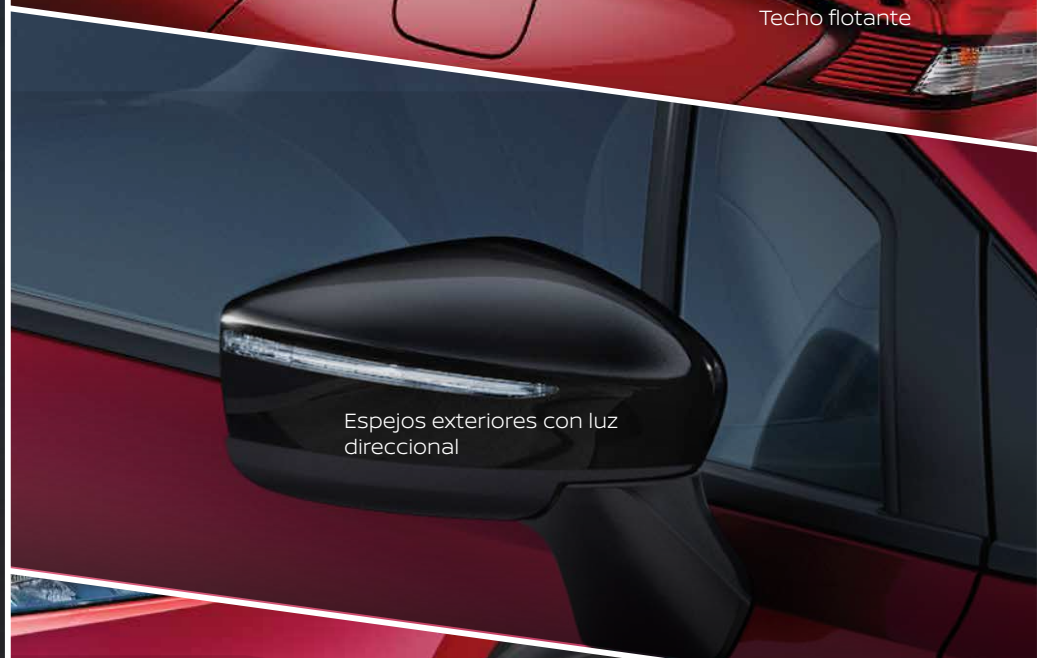
Espejos exteriores con luz direccional