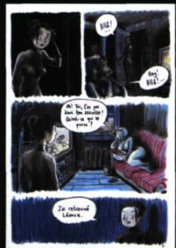
Planche extraite de l'album Appalaches , Colosse, 2007