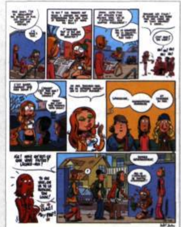
Planche extraite de l'album Les Nombres , Dupuis, 2006