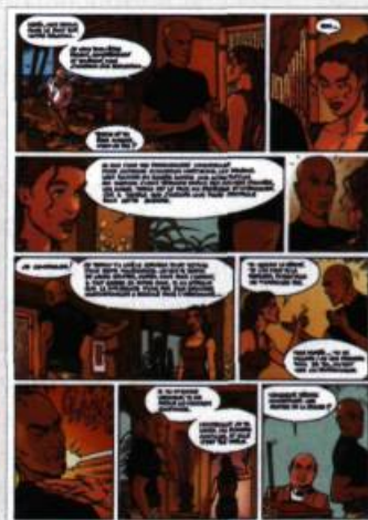
Planche extraite de l'album Moréa , tome 4, Un parfum d'éternité , Soleil, 2005