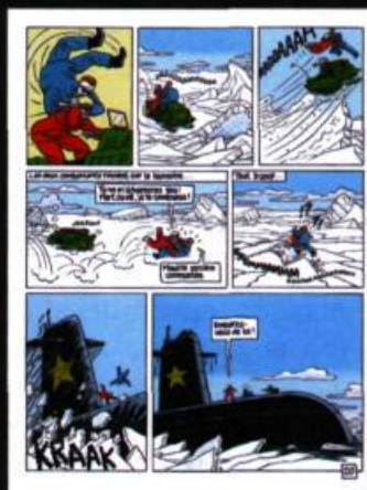
Planche extraite de l'album Kamarade Ultra , série Red Ketchup , Dargaud, 1991