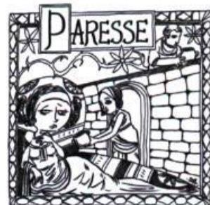
Planche extraite de l'album Mademoiselle , tome 3, Les péchés capitaux , Marchand de feuilles, 2007

Style et genre BD d'humour teintée d'ironie et d'autodérision Influences Pétillon (Jack Palmer), Bretécher, Serre et Loisel BD fétiches Bidouille et Violette de Hilaire, Cages de Dave Mc Kean Livre fétiche La Nuit des temps de René Barjavel Films fétiches Les Ailes du désir de Wim Wenders et Underground d'Emir Kusturica Publications Mademoiselle , 3 albums chez Marchand de feuilles C'est mieux à deux, enfin parfois... chez Albin Michel Participation au collectif Plan cartésien chez Mécanique générale Et vlan! (en collaboration avec Juste pour rire) chez La Pastèque Distinction Une des femmes de l'année 2004 selon le magazine Elle Québec Site Web www.evarollin.com