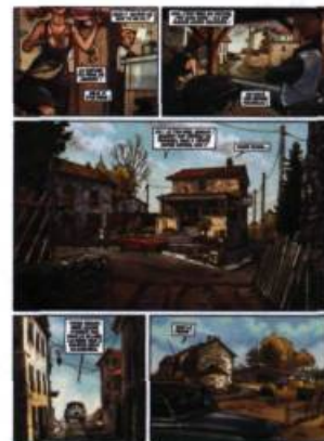
Planche extraite de l'album L'été 63 , à paraître en 2008 aux éditions Vents d'Ouest

Style et genre BD semi-réaliste, drame social et adaptation littéraire Influences Alberto Breccia, Will Eisner et Normand Rockwell BD fétiche Peter Pan de Loisel Livre fétiche L'Exorciste de William Peter Blatty Film fétiche Fargo de Joel Cohen Publications La Mare au Diable , éditions Mille-Îles Tard dans la nuit , avec Djian, 3 albums chez Vents d'Ouest L'Été 63 , à paraître chez Vents d'Ouest Distinctions Prix Bédéllys Québec en 2000 Prix Bédéis Causa en 2002