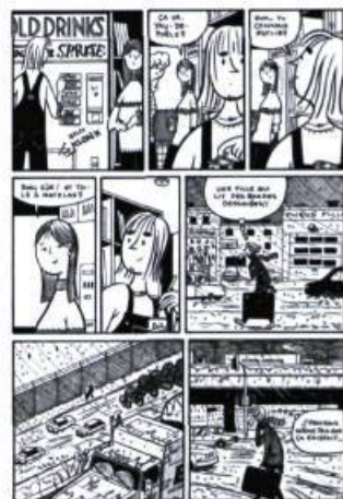
Planche extraite de l'album Paul en appartement , La Pastèque, 2004