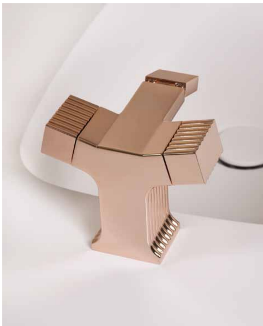
Gruppo monoforo per bidet Single-hole bidet mixer Mélangeur de bidet monotrou