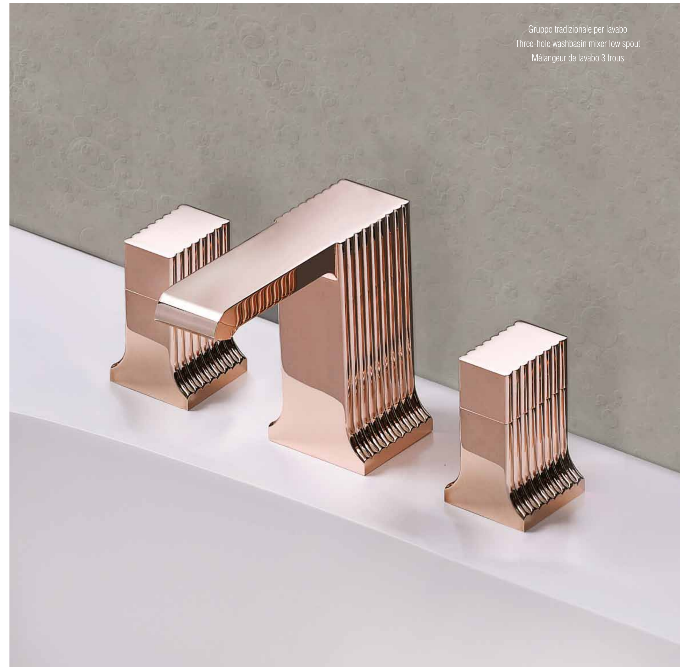
Gruppo tradizionale per lavabo Three-hole washbasin mixer low spout Mélangeur de lavabo 3 trous

Obtenu par un alliage d'or et de cuivre, cette nouvelle finition de prestige, plus discrète que l'or jaune, est plus dans goût du moment. Cette alliage très résistant dans le temps, ne s'oxyde pas en raison de sa forte présence en or, et est de plus antibactérien grâce au cuivre qui entre dans sa composition. En outre, il élimine complètement la présence de chrome hexavalent, objet de débat sur la pollution et sur les risques sanitaires.