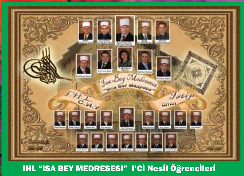
IHL "ISA BEY MEDRESESI" I'Ci Nesil Öğrencileri