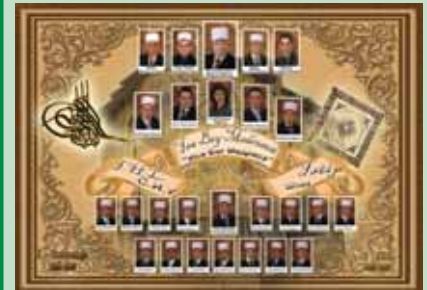
IHL "ISA BEY MEDRESESI" I'Ci Nesil Öğrencileri