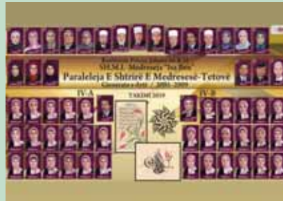
GJENERATA E DYTË E NXËNËSEVE TË SHMI "MEDRESEJA ISA BEU" PARALELJA E SHTRIRË E FEMRAVE – TETOVË