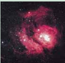
KUR'ANI DHE SHKENCA