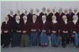
EDHE GOSTIVARI ME MEDRESE