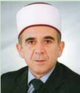
SHKOLLA E MESME ISLAME "MEDRESEJA ISA BEU" NDËR VITE