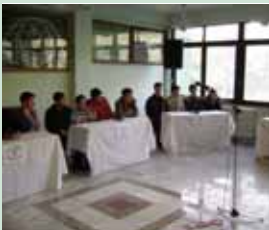
KUIZI I DITURISË "BAJRAMI 2008"