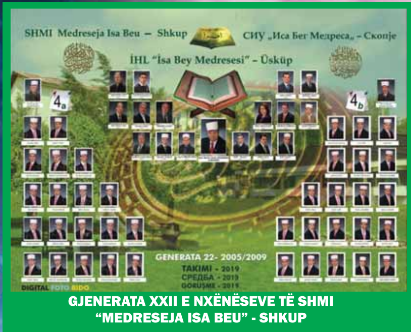
GJENERATA XXII E NXËNËSEVE TË SHMI "MEDRESEJA ISA BEU" - SHKUP