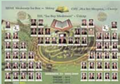
GJENERATA XXII E NXËNËSEVE TË SHMI "MEDRESEJA ISA BEU" - SHKUP