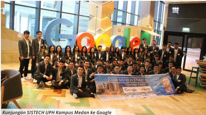
Kunjungan SISTECH UPH Kampus Medan ke Google