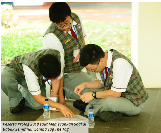
Peserta Prolog 2018 saat Memecahkan Soal di Babak Semifinal Lomba Tag The Tag

School of Information Science and Technology (SISTECH) UPH hadirkan acara tahunan National Programming and Logic Competition (PROLOG 2018) bagi siswa SMA/SMK dan yang sederajat pada 24-27 September 2018. Acara ini bertujuan untuk mengembangkan logika berpikir siswa sebagai dasar dalam pengambilan keputusan yang dibutuhkan, terutama ketika anak tersebut berminat melanjutkan studi di ilmu komputer.