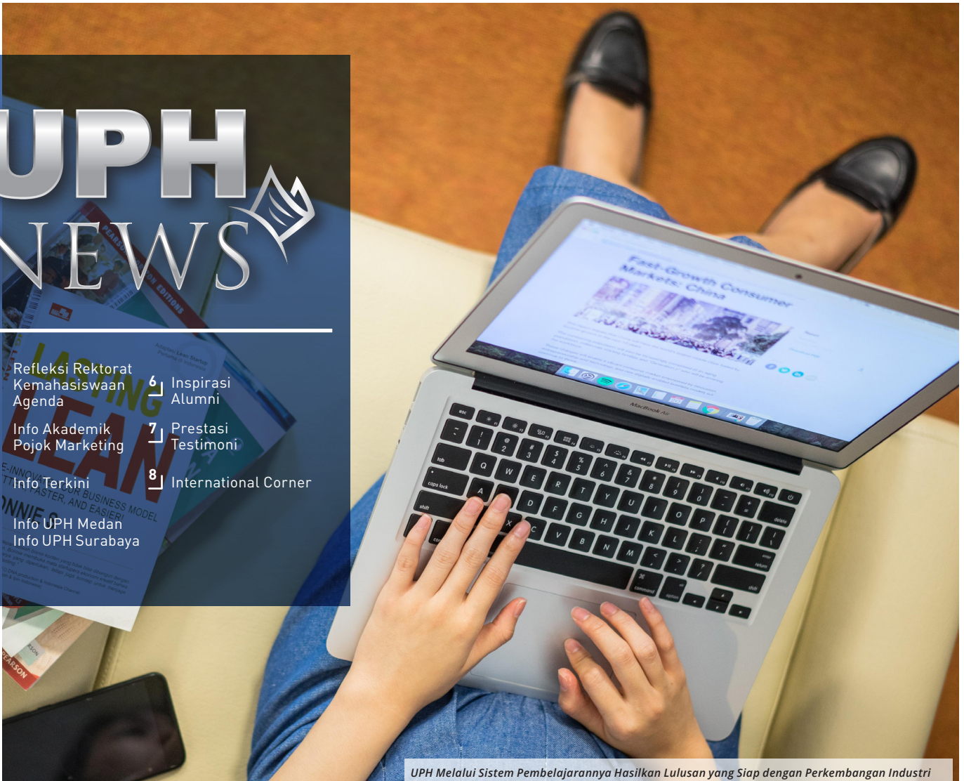
UPH Melalui Sistem Pembelajarannya Hasilkan Lulusan yang Siap dengan Perkembangan Industri