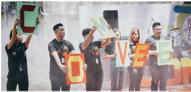
Comvee 2018 Dibuka Meriah dengan Penampilan Tari dan Flashmob Panitia

Himpunan Mahasiswa Program Studi (HMPS) Ilmu Komunikasi Universitas Pelita Harapan (Ilkom UPH) mengadakan Communication Avenue (Comvee) 2018 pada tanggal 3-8 September 2018 di UPH Lippo Village, Tangerang dengan mengangkat tema besar "Ignite Your Own Color". Acara ini merupakan ajang terbesar tahunan yang menyuguhkan berbagai kegiatan yang terkait bidang komunikasi yaitu seminar Digital Marketing , media company visit , perkenalan dan perekrutan anggota baru UPH Radio, serta enam