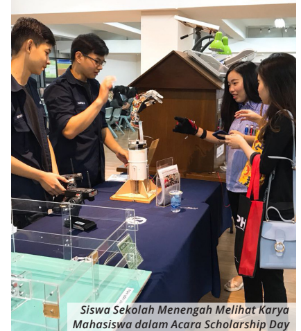
Siswa Sekolah Menengah Melihat Karya Mahasiswa dalam Acara Scholarship Day

Departemen Marketing dan Admission , UPH menyelenggarakan acara Scholarship Day yang berlangsung setiap Sabtu, dimulai dari tanggal 25 Agustus hingga 22 September 2018. Program ini bertujuan untuk memberi peluang yang lebih besar bagi calon mahasiswa yang ingin mendapat beasiswa hingga 100%.