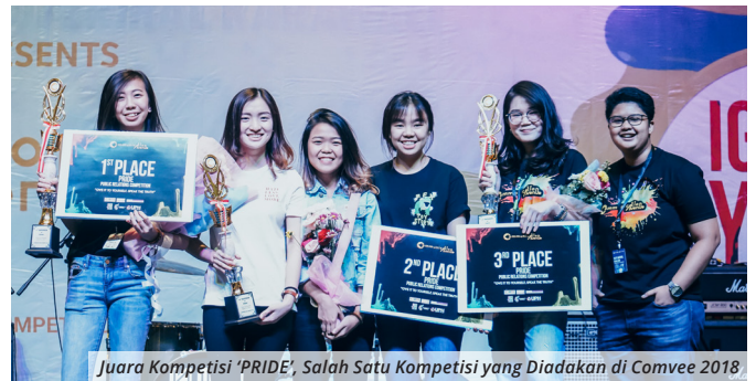
Juara Kompetisi 'PRIDE', Salah Satu Kompetisi yang Diadakan di Comvee 2018

Himpunan Mahasiswa Program Studi (HMPS) Ilmu Komunikasi Universitas Pelita Harapan (Ilkom UPH) mengadakan Communication Avenue (Comvee) 2018 pada tanggal 3-8 September 2018 di UPH Lippo Village, Tangerang dengan mengangkat tema besar "Ignite Your Own Color". Acara ini merupakan ajang terbesar tahunan yang menyuguhkan berbagai kegiatan yang terkait bidang komunikasi yaitu seminar Digital Marketing , media company visit , perkenalan dan perekrutan anggota baru UPH Radio, serta enam