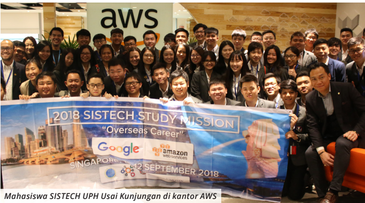
Mahasiswa SISTECH UPH Usai Kunjungan di kantor AWS

SISTECH (School of Information Science and Technology) UPH Kampus Medan menyelenggarakan Study Program Mission Trip “Overseas Career” ke Singapura. Kegiatan ini dilaksanakan pada tanggal 10-12 September 2018 atas inisiasi dari SISTECH bersama himpunan mahasiswa Program Studi (Prodi) Sistem Informasi. Kegiatan ini bertujuan untuk mendukung proses pembelajaran dan persiapan karir mahasiswa.