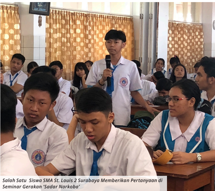
Salah Satu Siswa SMA St. Louis 2 Surabaya Memberikan Pertanyaan di Seminar Gerakan ‘Sadar Narkoba’

Fenomena perkembangan kejahatan narkoba yang begitu pesat, menjadi salah satu landasan bagi Jurusan Hukum UPH untuk membangun kesadaran bahayanya narkoba dari sejak dini. Sebagai bentuk kepedulian ini, maka beberapa school network UPH Kampus Surabaya berkolaborasi untuk menyelenggarakan seminar Gerakan “Sadar Narkoba” yang berlangsung pada 5 Oktober 2018 di SMA St.Louis