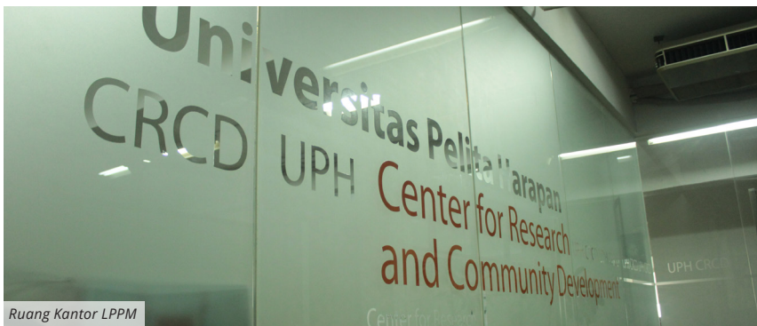
Ruang Kantor LPPM

Kinerja Penelitian dan Pengabdian Masyarakat (P2M) Universitas Pelita Harapan (UPH) terus mengalami peningkatan. Pada tahun 2010-2013, kinerja P2M UPH mendapatkan peringkat pada klaster Binaan, lalu meningkat menjadi klaster Madya pada tahun 2013-2016, dan sejak tahun 2016 meningkat lagi menjadi klaster Utama, sehingga UPH berhak menerima dan mengelola skim penelitian unggulan desentralisasi perguruan tinggi.