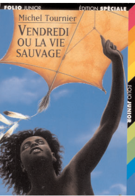
Illustration Pierre-Marie Valat

Vendredi ou la vie sauvage, de Michel Tournier