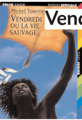
Illustration Pierre-Marie Valat