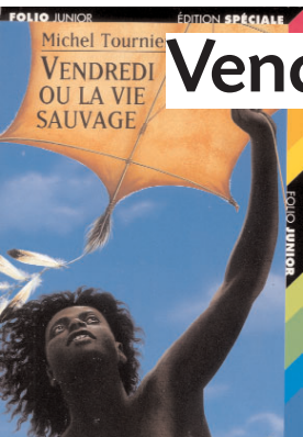
Illustration Pierre-Marie Valat