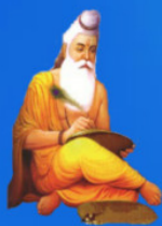
గురు వేదవ్యాస మహర్షి