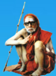
గురు చంద్రశేఖర పరమాచార్య