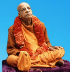
గురు భక్తవేదాంత ప్రభుపాద