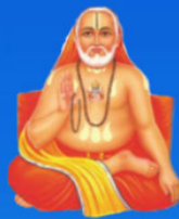
గురు రాఘవేంద్ర స్వామి