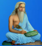
గురు వాల్మీకి మహర్షి