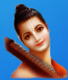
గురు నారద మహర్షి