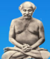
గురు లాహీరి మహాశయ