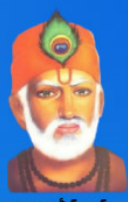
గురు కబీర్ దాస్