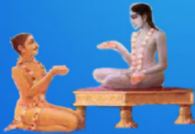
గురు శుక మహర్షి