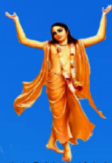
గురు చైతన్య మహా ప్రభువు