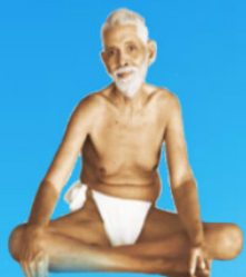
గురు రమణ మహర్షి