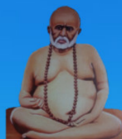
గురు వైలింగ్ స్వామి