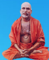
గురు మళయాళ స్వామి