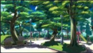
[Ver MAKO [Parking Molester Simulator] Private Cherry Elementary School-1.0 (B) Caps

Game CG ★★★★★ 2019-07-05 18:26 121 pages