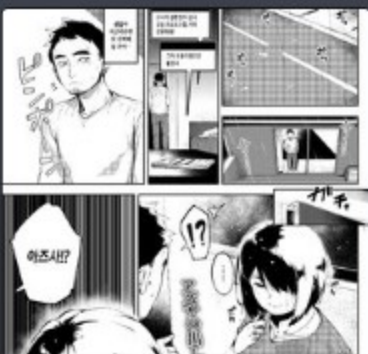
[Rocket Monkey] Ohanabatake no Naka de [꽃밭속에서 (COMIC HOTMILK 2019-08) [Korean] [Digital]