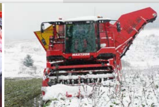
Russland Auch unter extremen Bedingungen extrem gut: der Rübenroder MAXTRON 620 beim Arbeitseinsatz in Russland.