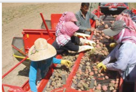
Libanon Das 7-köpfige Team arbeitet besonders effizient am Verleseband der Kartoffelvollerntemaschine.