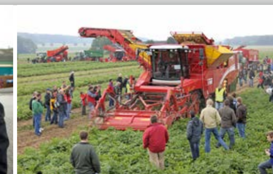
Maschinen im Einsatz Praktische Vorführungen bieten dem Anwender die hervorragende Möglichkeit, die innovative Kartoffel- und Rübentechnik „live“ zu erleben.