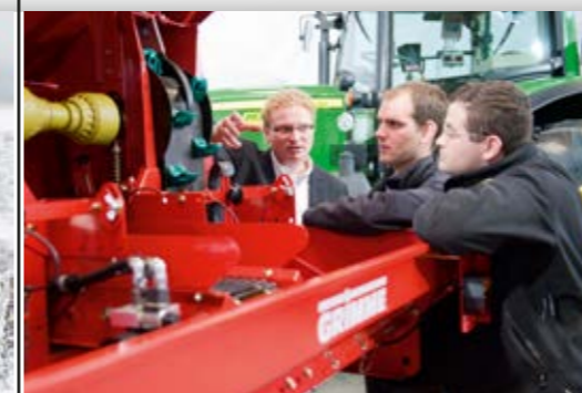
Individuelle Beratung Über 150 Maschinentypen mit je bis zu 200 Optionen erfordern hohe Fachkenntnis, um dem einzelnen Kunden die richtige Lösung für seine Anforderungen aufzuzeigen.