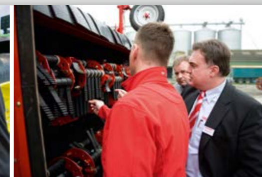
Erfahrungsaustausch Gespräche mit den Anwendern aus aller Welt sind die Voraussetzung, um praxisgerechte Lösungen zu entwickeln.