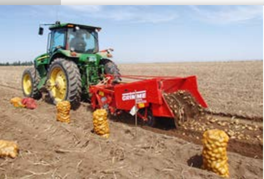
China Eine 2-reihig gezogene WH 200 im Einsatz in China.