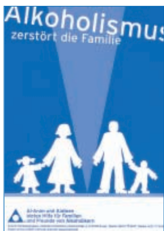
Poster „zerstörte Familie“

Format DIN A4, in Farbe Best.-Nr. 505 € 0,50 / SFr 1,00