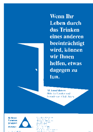
Alateen Poster „offene Tür“

Format DIN A4, in Farbe Best.-Nr. 502 € 0,50