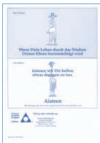
Alateen Poster „Giraffe“

Format DIN A4, in Farbe Best.-Nr. 505 € 0,50 / SFr 1,00