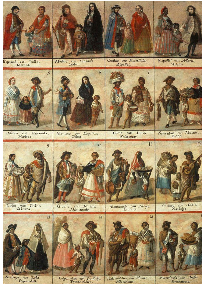
Figura 3: Listados de castas o mezclas entre razas humanas según los españoles