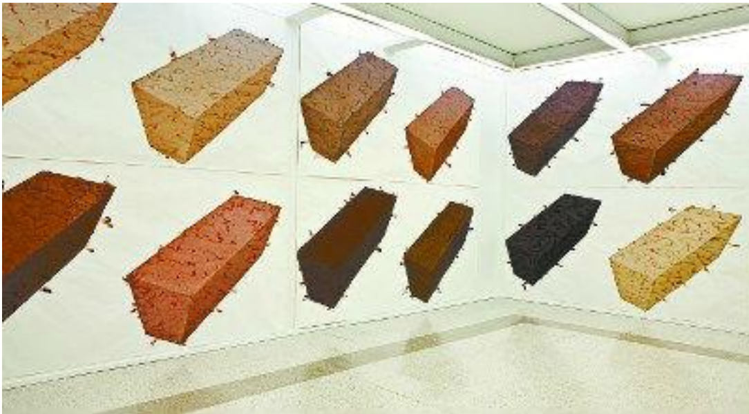
Figura 13: Color que soy - Museo de Arte de la Universidad Nacional de Colombia.