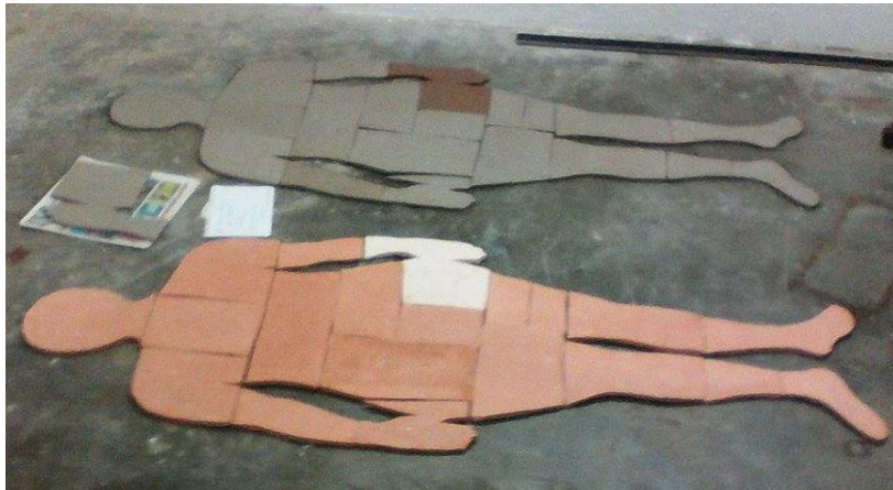
Figura 7: siluetas