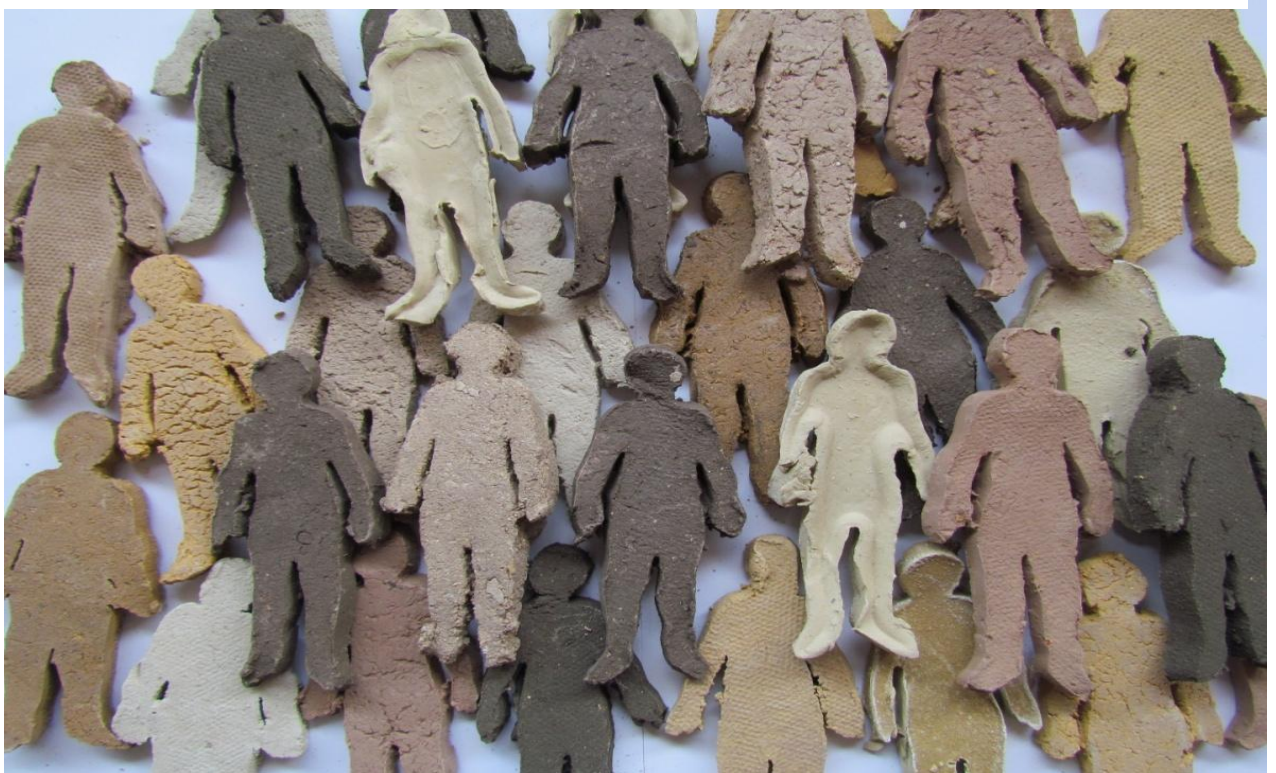
Figura 11: método utilizado para la organización de las figuras.

El propósito, es organizar en dos capas las figuras de arcillas sobre la superficie del suelo de una habitación o pasillo intercalando los colores; para luego, con la ayuda del público o el observador, quien entra a interactuar con la obra caminando sobre ella, se fragmenten las figuras y al mismo tiempo se mezclen entre sí por el desplazamiento sobre la obra, esperando generar con ello un solo color. El color de todos.