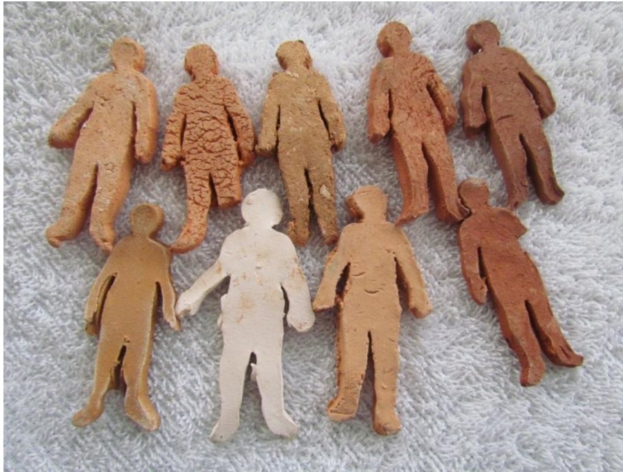
Figura 9: Prueba de quema de todos los colores recolectados..