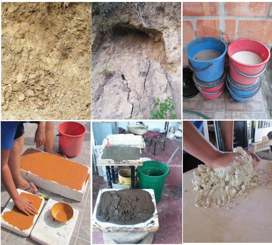
Figura 8 Proceso de recolección, limpieza, secado y amasado de las arcillas encontradas.