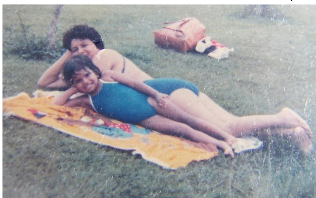
Figura 2 Mi mamá y yo, se nota la diferencia en el color de nuestra piel.