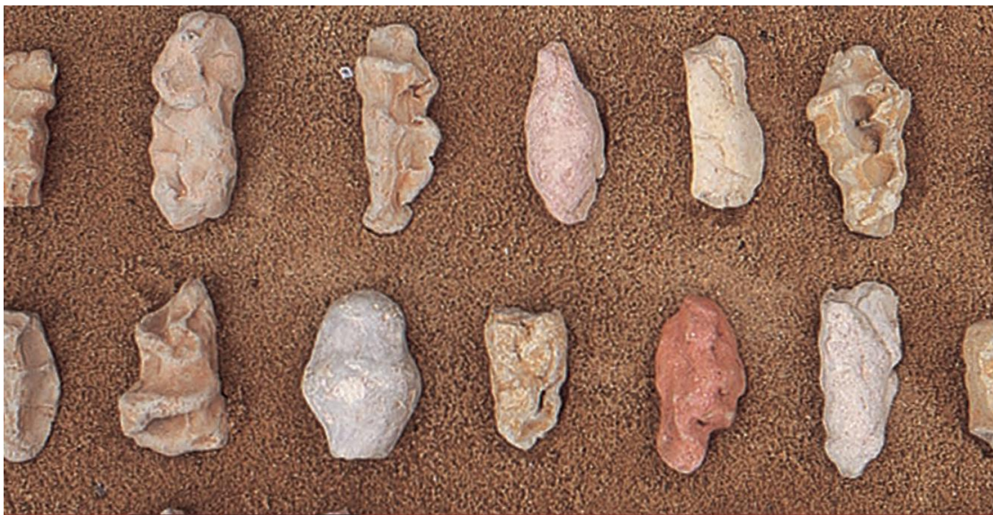
Figura 15: Amasadinhos - Celeida Tostes.

Esta artista ha sido mi referente más importante, ya que sus trabajos se relacionan en gran medida al tema de la arcilla y el cuerpo; la fuerza simbólica de estos es resultado del constante proceso experimental durante su vida artística. Celeida hace uso de la materia en todos sus estados, la preocupación por el color ya la constante repetición de