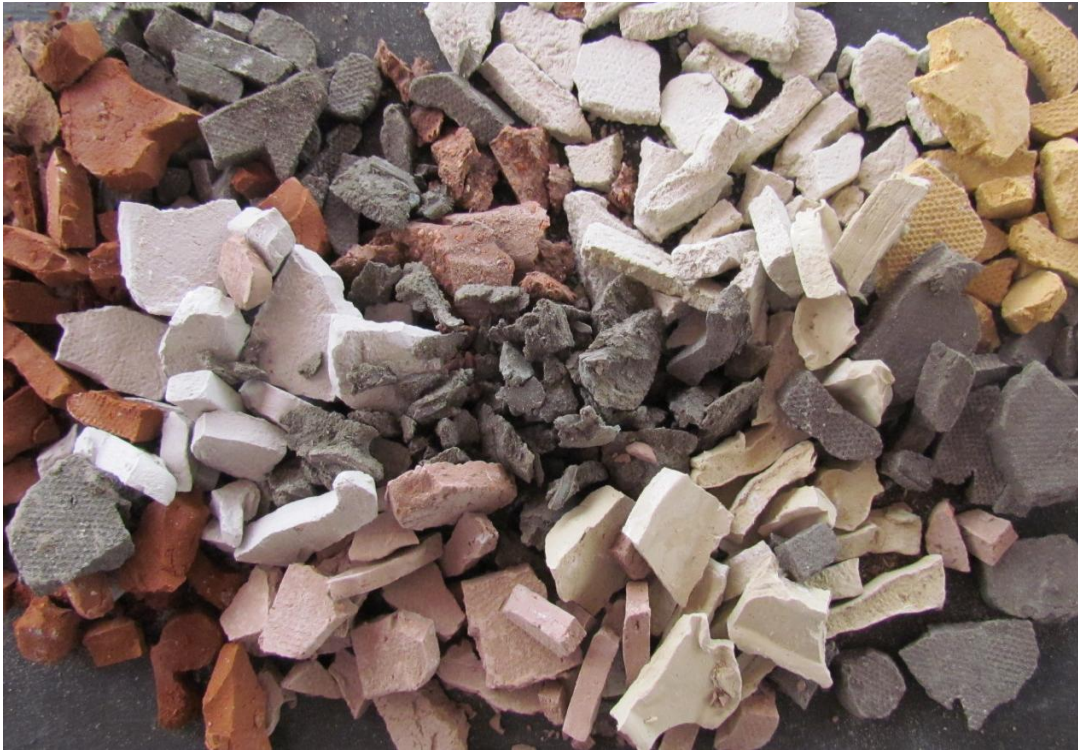
Figura 12: fragmentos recolectados