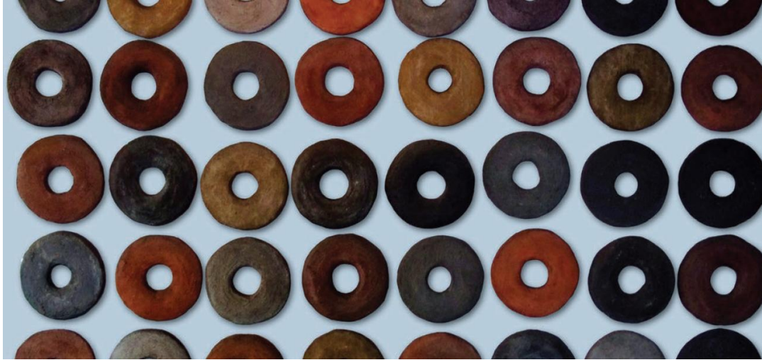
Figura 16: Serie Ruedas,

elementos en trabajos como “Amasadinhos” me encaminan en el desarrollo de geo Colores de un Cuerpo.