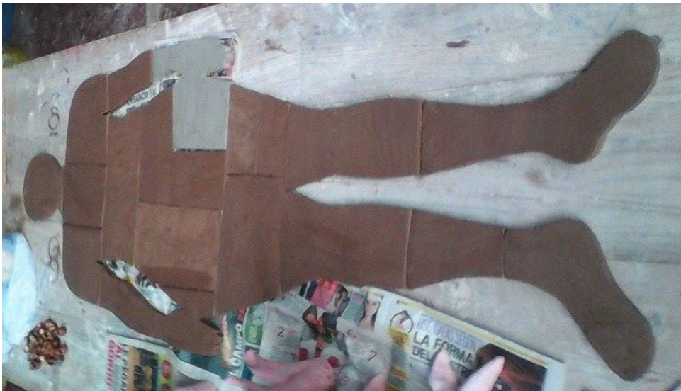
Figura 5: experimentación con Siluetas en tamaño real de mi cuerpo. para explicar el desarrollo de mi proceso:

He dicho en uno de los problemas, porque fueron varios y creí pertinente enumerarlos