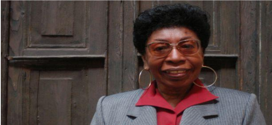
Figura 14. Victoria Santa Cruz.