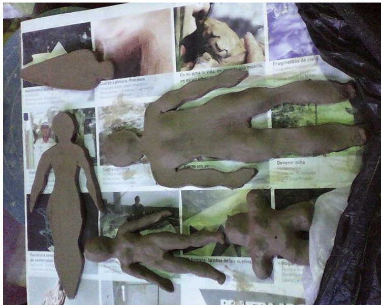
Figura 4 Experimentación con pastas cerámicas.

Habiendo decidido la materia, empiezo mi experimentación con la pasta cerámica que me era facilitada en el aula de cerámica de la Universidad del Tolima; es decir, buscar interactuar con ella de la manera correcta para enfocar mi idea.