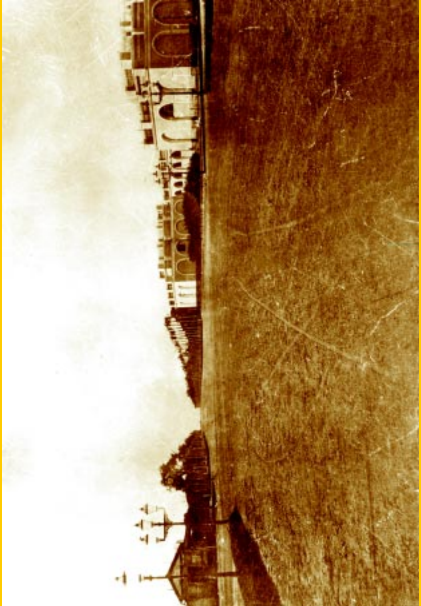
Avenida de las Palmeras (hoy avenida Sarmiento). (Foto Archivo General de la Nación).