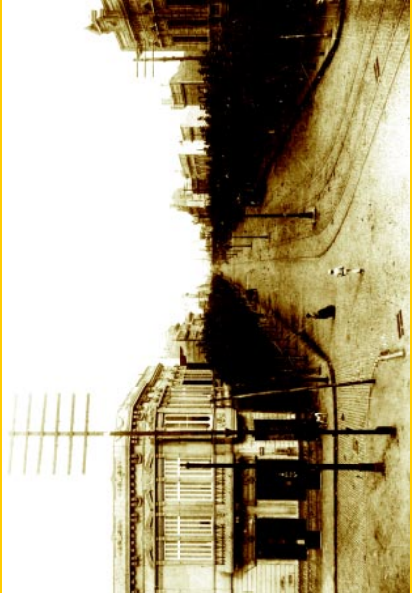
Alegría (hoy Wenceslao Villafañe) y Almirante Brown en 1903.