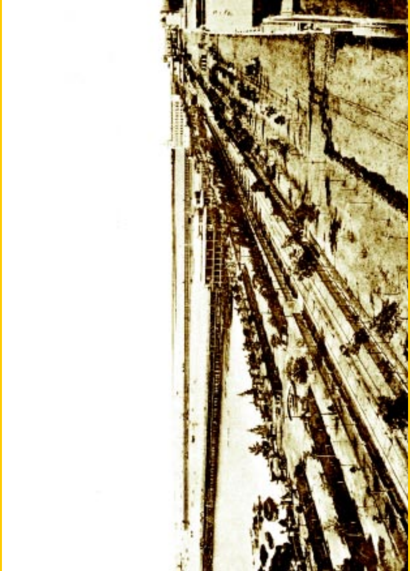
Paseo de Julio y muelles de pasajeros y de la Aduana. Lámina N° 43 Fotografía Witcomb, en Casa Witcomb, Buenos Aires antiguo , Buenos Aires, Peuser, 1925.