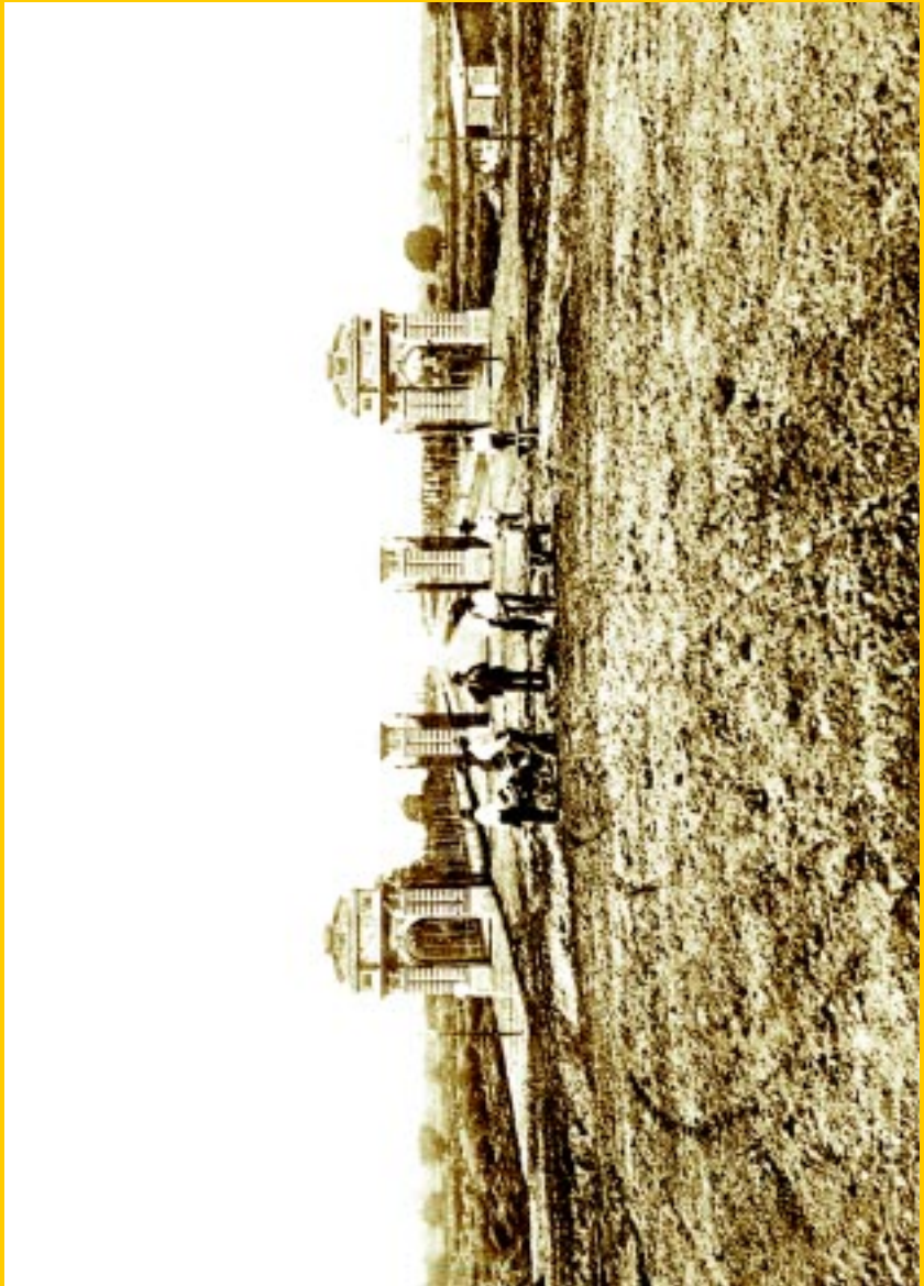
Portones de Palermo (cabecera de la actual avenida Sarmiento). Lámina N° 35 Fotografía Witcomb, en Casa Witcomb, Buenos Aires antiguo , Buenos Aires, Peuser, 1925.