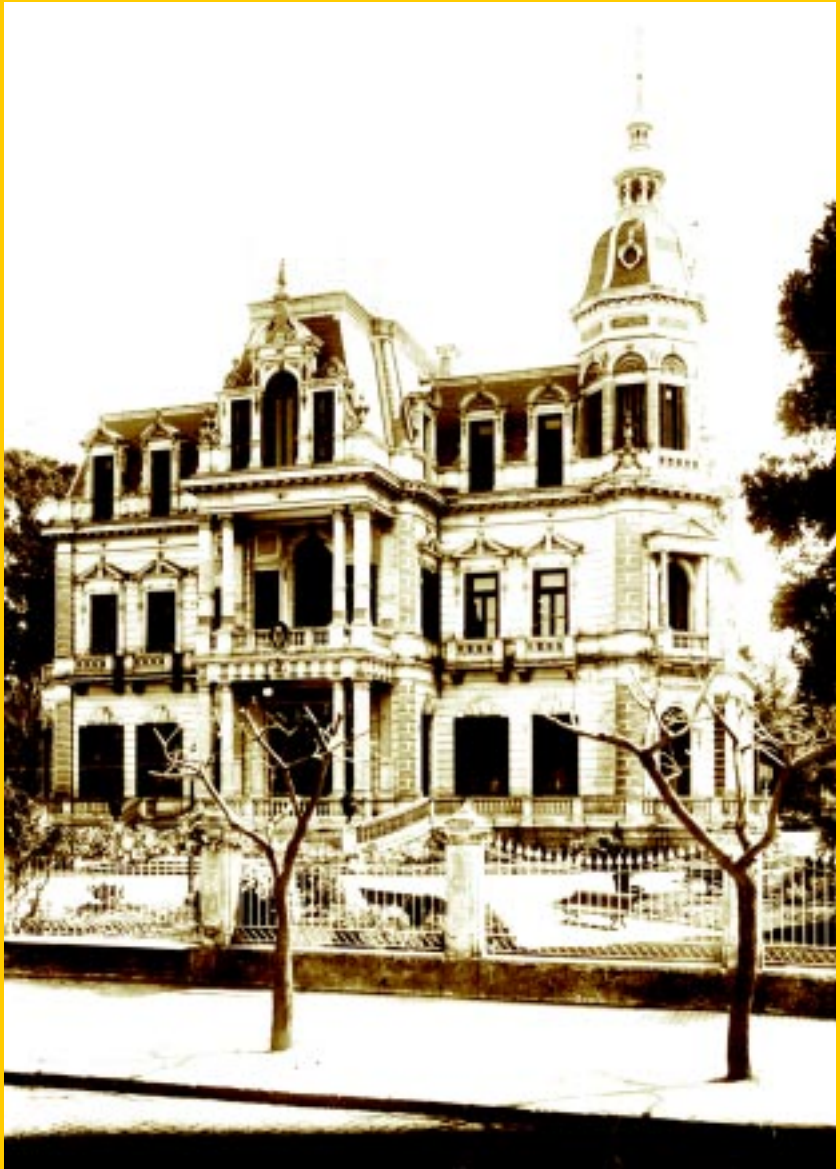
Residencia de la familia Videla Dorna, cuando era sede de la Escuela Naval Militar. El apellido de esta familia denominó a la actual calle Florencio Balcarce (año 1904).