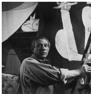
Dora Maar, Photographie de Picasso en train de peindre Guernica.

Picasso est-il le dernier génie artistique ?