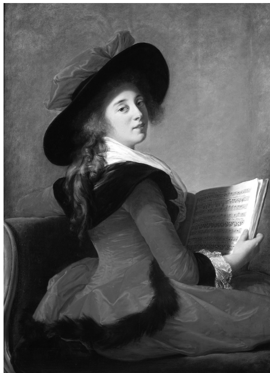
Portrait de la baronne de Crussol Florensac, 1785 Toulouse, musée des Augustins

à 15h et à 17h 14 et 28 octobre les mercredis 4, 18 et 25 novembre 2 décembre