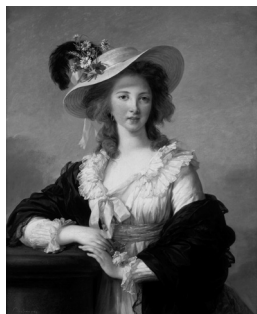
La duchesse de Polignac, Portrait au chapeau de paille , 1782 Versailles, châteaux de Versailles et de Trianon

Grand Palais, Galeries nationales - Entrée Clemenceau