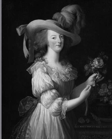
Portrait de Marie-Antoinette en robe de mousseline dite "en gaulle", 1783 Kronberg, Hessisches Hausstiftung