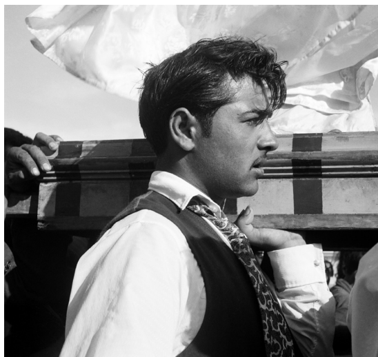
Lucien Clergue, Jeune gitane portant la statue de Sainte Sara, les Saintes-Maries-de-la-mer , 1959

de Jean Cocteau, 1960, avec Jean Cocteau, Jean Marais et Maria Casarès, 1h20