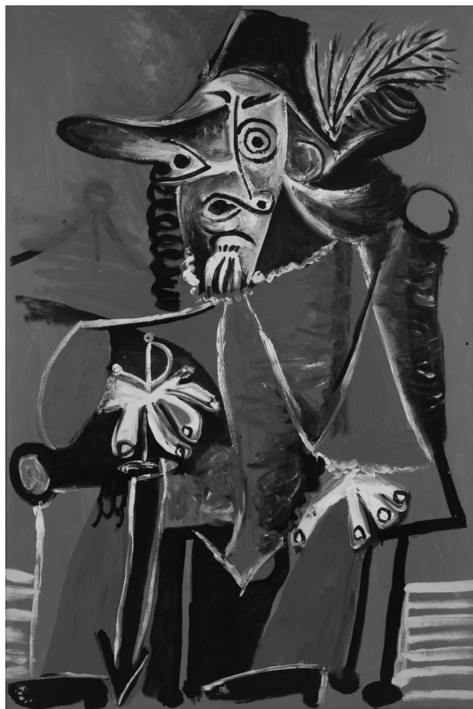
Mousquetaire à l'épée assis.