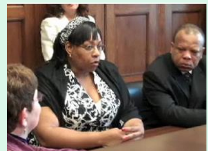
Arriba, miembros de St. Camillus visitan a su senador para compartir su preocupación por la guerra en la RDC. Abajo, venden artesanías.

En la parroquia, marcharon con el pie de las obras de caridad llevando a cabo una venta de artesanías en beneficio de los programas de Catholic Relief Services que ayudan a las víctimas de la guerra en la RDC.