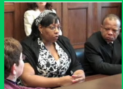
Arriba, miembros de St. Camillus visitan a su senador para compartir su preocupación por la guerra en la RDC. Abajo, venden artesanías.

En la parroquia, marcharon con el pie de las obras de caridad llevando a cabo una venta de artesanías en beneficio de los programas de Catholic Relief Services que ayudan a las víctimas de la guerra en la RDC.