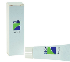
Aloe Vera Pflegecreme Hautpflegegel mit Aloe Vera für Hörgeräte-träger für die Anwendung im Ohr. Ihre Haut fühlt sich an der beanspruchten Stelle wieder wohl um Ihnen ein angenehmes Tragegefühl Ihres Hörgeräts zu geben.