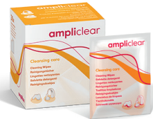
Reinigungstücher Feuchte Tücher zur Einmalverwendung für die Reinigung und Desinfektion von Hörgeräten.