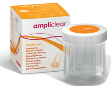
Reinigungsbecher Becher mit speziell geformtem Einsatz für die Reinigung der Ohrstücke mit ampliclear Reinigungstabletten.