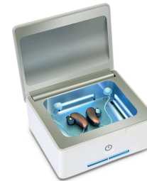
PerfectDry Lux Trockensystem Elektrische Trockenbox für die Wartung und Instandhaltung aller Arten von Hörgeräten. Die Kombination von Belüftungs-Trocknung und UV-C Strahlen-Desinfektion pflegt und reinigt die Hörgeräte.