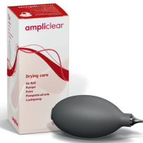
Pumpe Blaspumpe zum Trocknen der Ohrstücke.