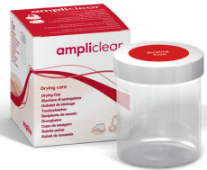
Trockenbecher Becher zum Trocknen der Hörgeräte.