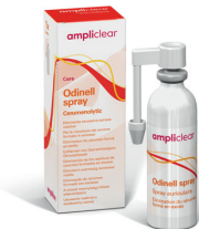
Reinigungsspray Speziell für die Reinigung und Desinfektion der Hörgeräte und Ohrstücke. Erhöht die Lebensdauer der Hörsysteme.