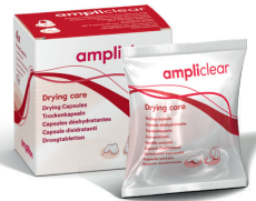
Trockenkapseln Absorbieren das in Hörgeräten gebildete Kondenswasser und schützen die Hörsysteme so vor Schäden durch Feuchtigkeit.