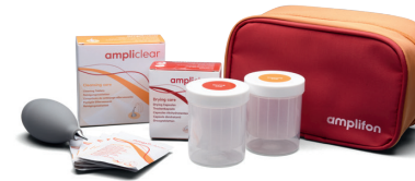
Hörgeräte-Reinigungsset Jeweils erhältlich als spezielles Set für Hinter-dem-Ohr-Hörgeräte, Im-Ohr-Hörgeräte und Mini-HdO-Hörgeräte.