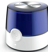
Ultraschall U-Sonic Befreit Ohrstücke mit Hilfe von ultraviolettem Licht von Mikroorganismen, Bakterien sowie Pilzen und lässt Kondenswasser verdunsten.