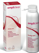
Luftspray Druckluft aus der Spezialflasche zur optimalen Trocknung Ihrer Hörgeräte.