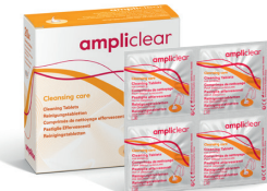
Reinigungstabletten Reinigungstabletten mit aktivem Sauerstoff für Ohrstücke.