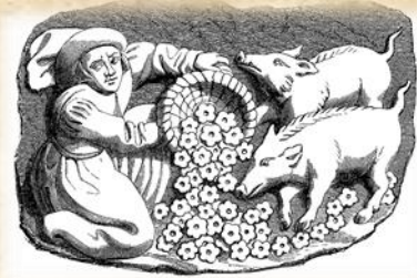
—Stat of Carved Wood (Fifteenth Century), representing the Proverb, "Margaritae"

Doch de onderwijzing aan een gelovige, hij zal dankbaar worden voor de uitleg van de blijde boodschap. Werp geen parelen voor de zwijnen! God vergelijkt de ongelovige spotter en weerspannige met zwijnen. (Matth.7:8) De gelovige is wijs geworden door Christus, maar niet door eigen bekwaamheid, wijsheid, kennen of kunnen.