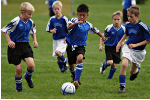
13. Los niños _____ fútbol