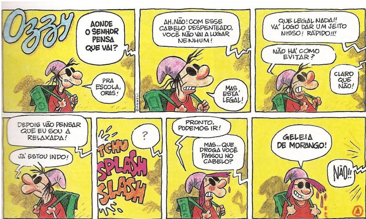
Angeli. Ozzy 1, Caramba! Mas que garoto rabugento! São Paulo: Companhia das Letras, 2006. p. 7.

01- Quem são os personagens que dialogam na história?