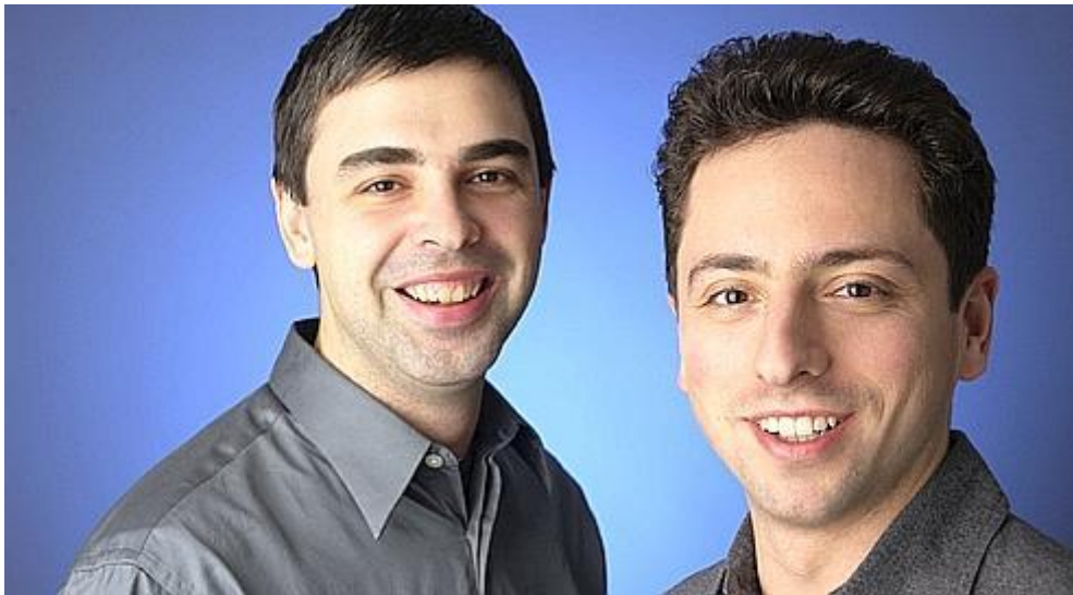
Larry Page y Sergey Brin

Todo el mundo conoce el nombre Google, pero nadie conoce la historia de esta empresa, es lo que me interesa ahora.