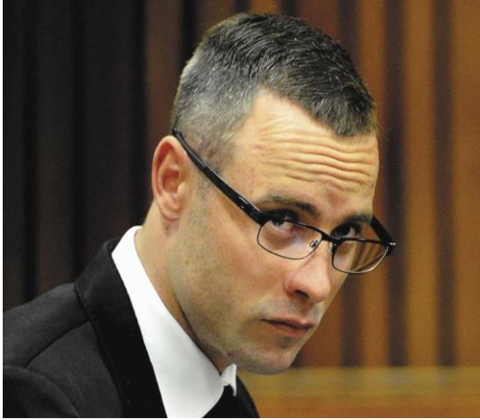
Oscar Pistorius in die hof. Die Burger: Dinsdag, 6 Mei 2014

Lees die onderstaande uittreksel uit 'n koerantberig en beantwoord dan die taalvrae wat daarop volg.