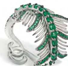
Anello in oro bianco con smeraldi.

White gold palm bracelet with white diamonds.