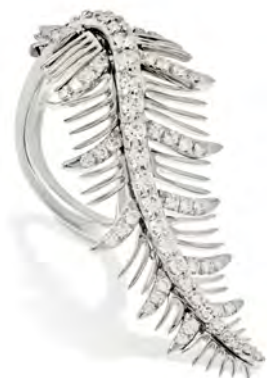
Anello in oro bianco con diamanti bianchi.