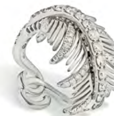
Anello in oro bianco con diamanti bianchi.