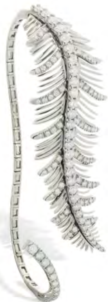
Palmare in oro e diamanti bianchi.

White gold palm bracelet with white diamonds.