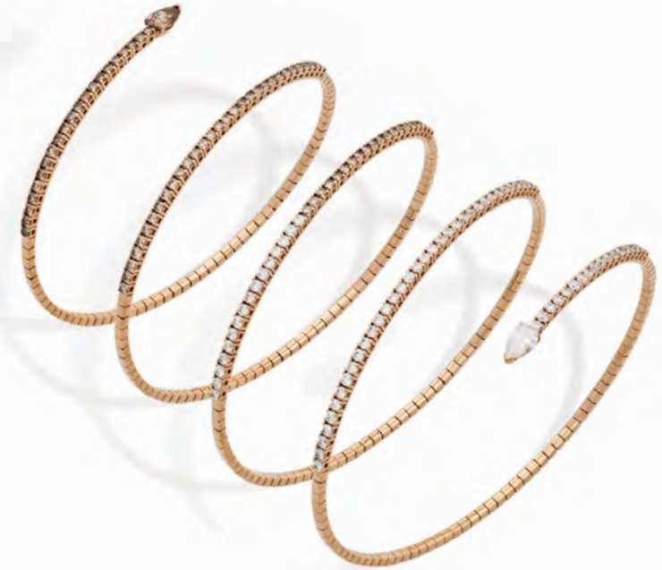
Bracciale Dune Bracciale in oro rosa con diamanti fancy brown e bianchi. Rose gold bracelet with fancy brown and white diamonds.