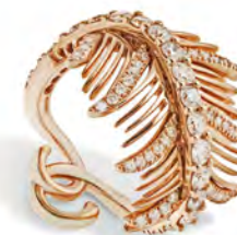
Anello in oro rosa con diamanti bianchi.