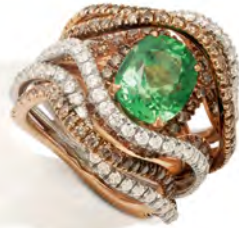
Anello in oro rosa con diamanti bianchi e fancy brown. Rose gold ring with white and fancy brown diamonds.