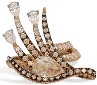
Anello in oro rosa con diamanti bianchi e fancy brown. Rose gold ring with white and fancy brown diamonds.