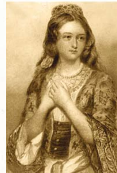
Ignacia Rodríguez de Velasco y Osorio.