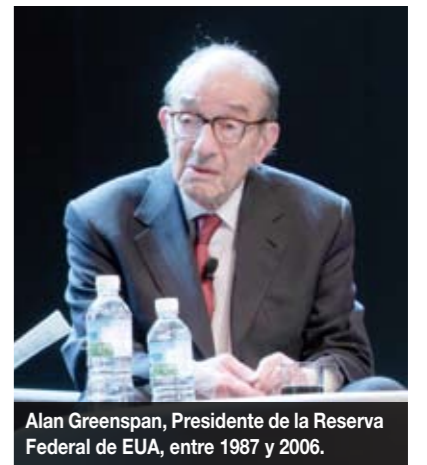
Alan Greenspan, Presidente de la Reserva Federal de EUA, entre 1987 y 2006.

José reconoció que no hubiera sido posible sin los principios que le inculcaron sus padres: saber qué es lo que quieres ser en la vida, saber dónde estás y saber los pasos para llegar a tu destino.