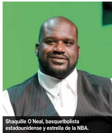
Shaquille O'Neal, basquetbolista estadounidense y estrella de la NBA.