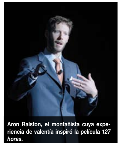
Aron Ralston, el montañista cuya experiencia de valentía inspiró la película 127 horas .