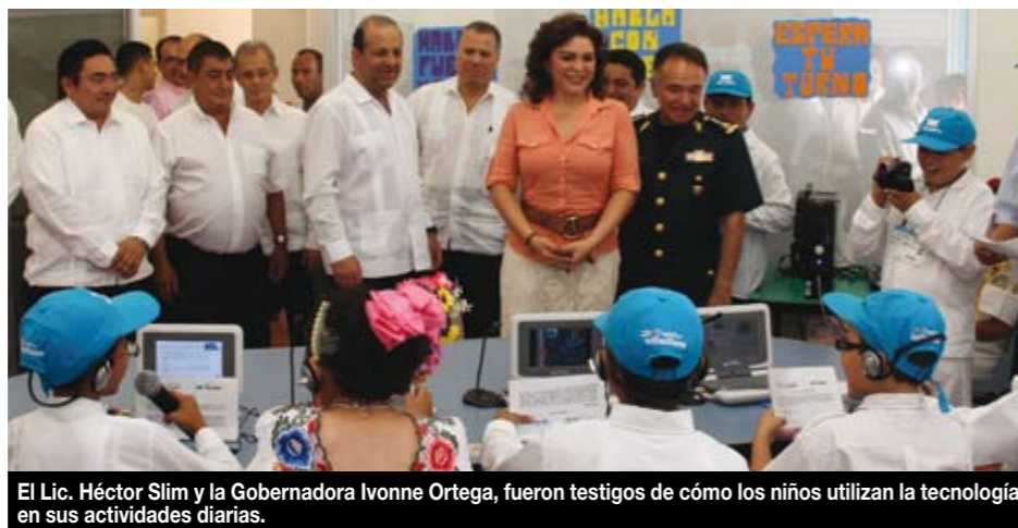
El Lic. Héctor Slim y la Gobernadora Ivonne Ortega, fueron testigos de cómo los niños utilizan la tecnología en sus actividades diarias.

En este evento destacó la presentación de 15 talleres que se impartirán en lengua maya, adicionales a los 300 que ya existen, con el fin de fortalecer y fomentar en todos los visitantes de Casa TELMEX la cultura maya y tradición yucateca, así como una visión multicultural y tecnológica de este estado.