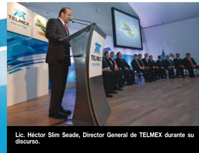
Lic. Héctor Slim Seade, Director General de TELMEX durante su discurso.

En este sentido, nuestra Empresa y el Comité desarrollaron una de las plataformas más robustas para colaborar y compartir los proyectos IT más eficientes con el fin de solucionar las necesidades de seguridad, salud, educación y cultura digital de los gobiernos de los 31 estados de la República Mexicana y sus municipios, además el Distrito Federal, generando enormes beneficios para los ciudadanos y sus gobiernos.