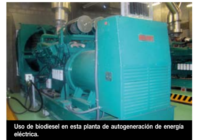
Uso de biodiesel en esta planta de autogeneración de energía eléctrica.