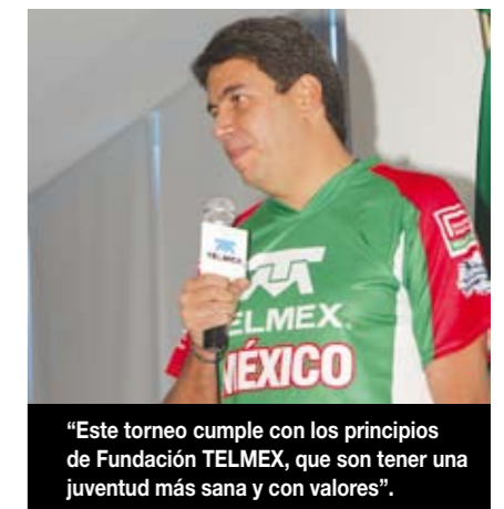
“Este torneo cumple con los principios de Fundación TELMEX, que son tener una juventud más sana y con valores”.

400 jóvenes que han jugado en el Torneo. Ellos habían sacrificado su tiempo y su dinero, por lo que buscaron una Empresa Socialmente Responsable que además creyera en las bondades del deporte y se acercaron a Fundación TELMEX para ver si podíamos entrar y hacerlo del doble de su tamaño.