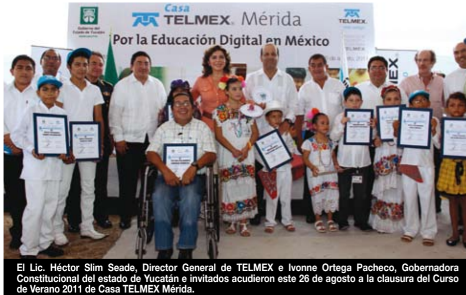
El Lic. Héctor Slim Seade, Director General de TELMEX e Ivonne Ortega Pacheco, Gobernadora Constitucional del estado de Yucatán e invitados acudieron este 26 de agosto a la clausura del Curso de Verano 2011 de Casa TELMEX Mérida.

El Lic. Héctor Slim Seade, Director General de TELMEX e Ivonne Ortega Pacheco, Gobernadora del estado de Yucatán acudieron este 26 de agosto a la clausura del Curso de Verano 2011 de Casa TELMEX Mérida, en donde presenciaron demostraciones sobre el uso de las Tecnologías de la Información y entregaron reconocimientos a los usuarios destacados.