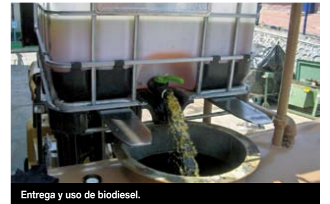
Entrega y uso de biodiesel.

Con la recolección de aceite vegetal, TELMEX contribuye a la preservación del medio ambiente aplicando una política en la que se cumple con la legislación en esta materia, se desarrolla una cultura en pro de la ecología, se administran eficientemente los recursos, y se propicia el uso de energías alternas como el biodiesel.