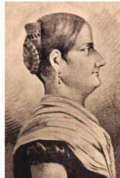
Doña Josefa Ortiz de Domínguez.

Las fuentes de información sobre este tema son abundantes. Y fue precisamente el año pasado, en medio de las celebraciones del Bicentenario de nuestra Independencia que salieron a la luz nuevas investigaciones apasionantes que nos acercan al tema. Así, no sólo las criollas acomodadas, sino mujeres del pueblo, mestizas e indias y hasta esclavas, intervinieron en forma activa en la lucha por la emancipación. Incluso las monjas, quienes aparentemente aguardaban pasivas las noticias de la guerra, tomaron partido desde sus espacios, fuera por los insurgentes o fuera por los realistas, lo que dividió enormemente los monasterios.