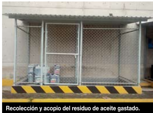
Recolección y acopio del residuo de aceite gastado.