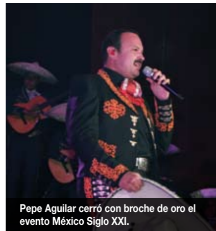
Pepe Aguilar cerró con broche de oro el evento México Siglo XXI.

El evento cerró con un concierto del cantante y compositor Pepe Aguilar quien hizo pasar un agradable momento a todos los Becarios.