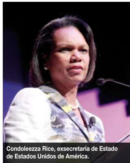
Condoleezza Rice, exsecretaria de Estado de Estados Unidos de América.