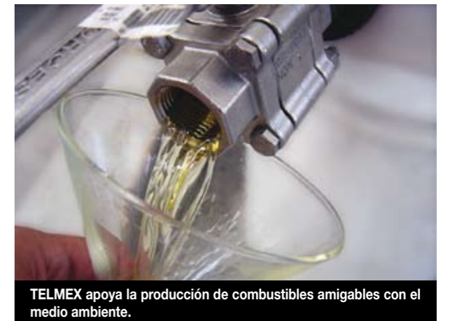
TELMEX apoya la producción de combustibles amigables con el medio ambiente.