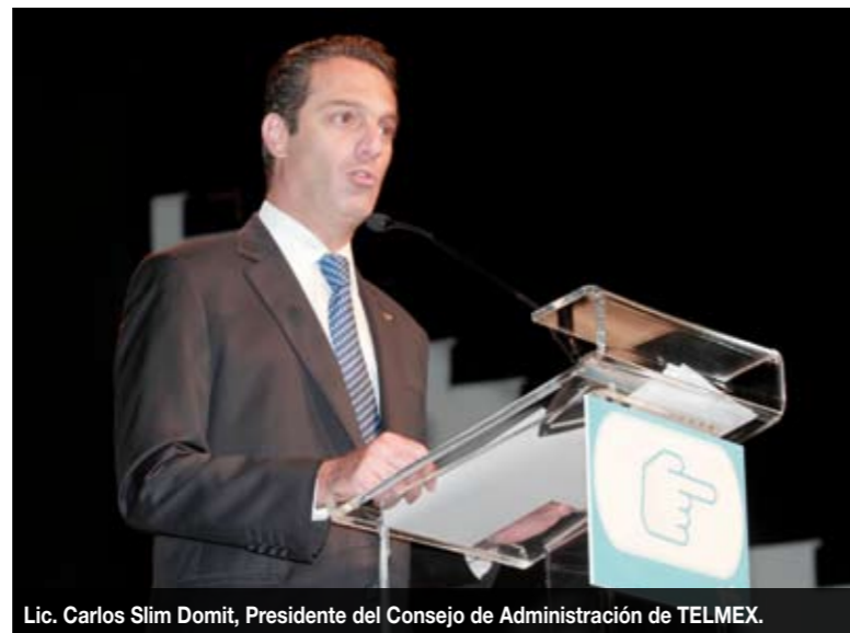
Lic. Carlos Slim Domit, Presidente del Consejo de Administración de TELMEX.

El Lic. Slim Domit aseguró que TELMEX ha asumido el compromiso de llevar telecomunicaciones a todos los rincones del país en condiciones de oferta y precio accesibles y atractivos,