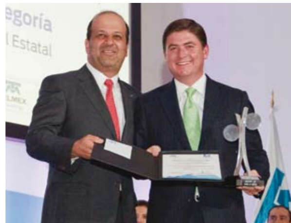
Lic. Héctor Slim Seade, Director General de TELMEX y Lic. Rodrigo Medina de la Cruz, Gobernador del estado de Nuevo León y Presidente de la Asamblea General del CIAPEM.

Práctica: Portal del Estado de Nuevo León Este portal evolucionó al integrar las redes sociales a fin de ofrecer información a los ciudadanos, y mejorar las gestiones del gobierno.