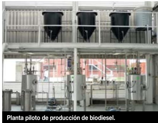
Planta piloto de producción de biodiesel.