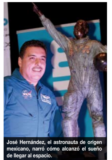
José Hernández, el astronauta de origen mexicano, narró cómo alcanzó el sueño de llegar al espacio.