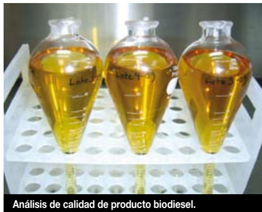
Análisis de calidad de producto biodiesel.