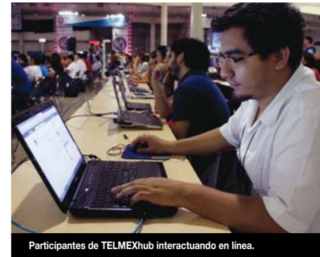
Participantes de TELMEXhub interactuando en línea.

Como parte de la experiencia de la Gira TELMEXhub, los asistentes pueden interactuar mediante Livetweets (mensajes por Twitter en tiempo real) y preguntas con los ponentes. También hay espacio para la diversión ya que sus participantes se pueden inscribir en los torneos de videojuegos y disfrutar de la proyección de películas.