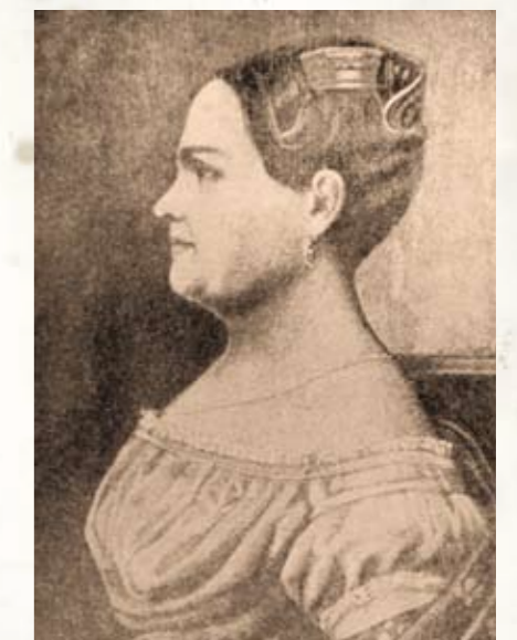
Doña Leona Vicario.

Los nombres de estas mujeres se multiplican. Otras, pasaron al olvido, sobre todo aquellas que entraron a la guerra y atendían a los hombres elaborando alimentos con lo que encontraban en los caminos, pueblos y villas. Salta la pregunta ¿por qué estudiar a las mujeres en la Insurgencia? Porque en la historia oficial, salvo algunas excepciones, pasan desapercibidas. Porque ellas también fueron forjadoras de la Independencia y muchas dieron su vida por un ideal. Porque con las investigaciones de las nuevas generaciones se responden preguntas novedosas que hacen de nuestra historia nacional una enseñanza para la sociedad.