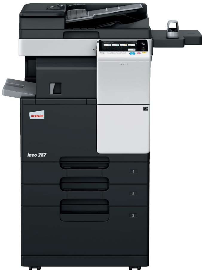
ineo 287 con alimentador (DF-628), finalizador interno (FS-533), mesa cassette (PC-413) y autenticación biométrica (AU-102)

Centros de trabajo, escuelas y universidades, empresas de ingeniería, oficinas de arquitectura, compañías de seguros, bancos, bibliotecas: muchas pequeñas empresas y organizaciones de tamaño medio realmente no necesitan impresión en color. Lo que sus usuarios realmente necesitan es un dispositivo multifuncional monocromo intuitivamente fácil de usar y que ofrezca una sencilla interacción con dispositivos móviles para el creciente número de trabajadores que los utilizan.