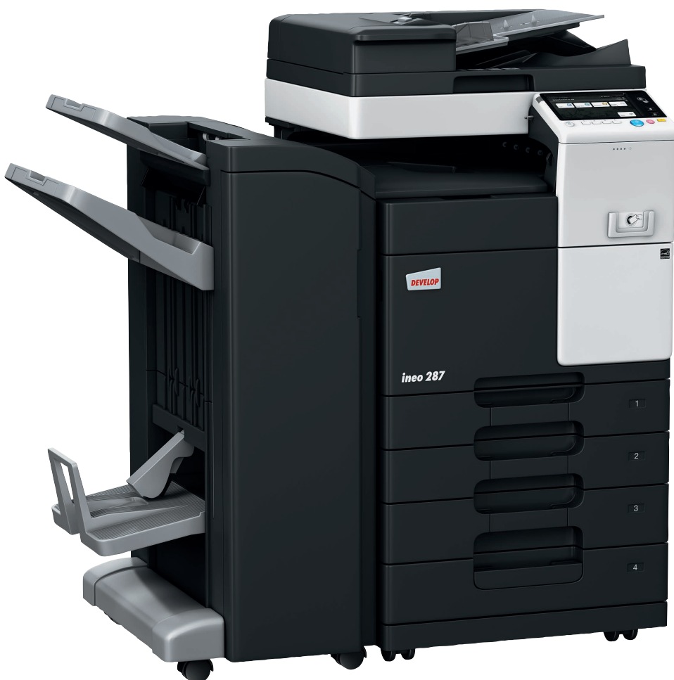
ineo 287 con alimentador (DF-628), finalizador grapador/plegador (FS-534SD), mesa cassette (PC-213) y kit de instalación para lector de tarjetas (MK-735)

Los dispositivos monocromo ofrecen una variedad de funciones de ahorro de energía que reducen el consumo de energía. Además de ahorrar dinero, estas características ecológicas también son respetuosas con el medioambiente.