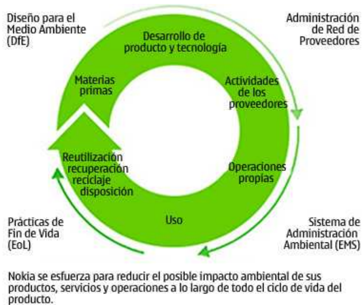
Figura 2: concepto ambiental Nokia basado en ciclo de vida

El trabajo ambiental de Nokia se basa en el concepto de ciclo de vida. Esto apunta a minimizar el impacto ambiental de los productos, comenzando con la extracción de materias primas y terminando con el reciclaje, tratamiento y la recuperación de materiales.