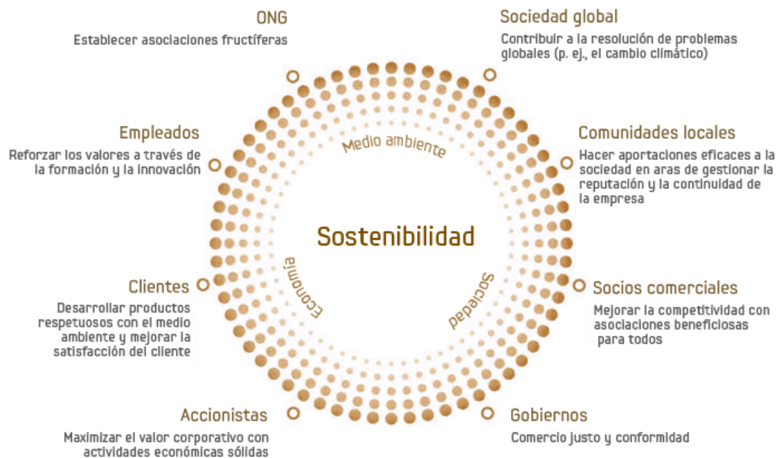
Figura 3 Política de sostenibilidad de Samsung

La política de sostenibilidad en SAMSUNG se centra en las siguientes áreas: