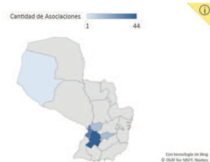
Figura 1. Localización de asociaciones de artesanos por Departamento. Año 2014