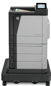
HP Color LaserJet Enterprise M651xh nyomtató