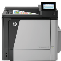
HP Color LaserJet Enterprise M651dn nyomtató

Megbízható teljesítmény: nagy volumenű, professzionális minőségű, kétoldalas színes dokumentumok és kimagasló megbízhatóság. A hatékony egyérintéses és mobil nyomtatási lehetőségeknek, valamint az egyszerű kezelhetőségnek köszönhetően bárhol hatékonyan dolgozhat munkája során.