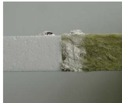
EPS is rot- en schimmelvrij en vormt geen voedingbodem voor schimmels en bacteriën