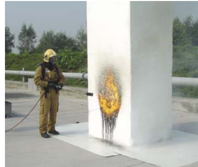
Altijd in brandveilige SE-kwaliteit