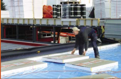
plat dak isolatie