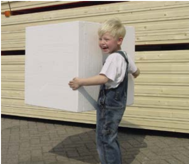
Licht van gewicht