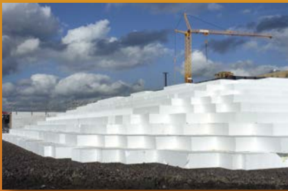
algemene toepassingen (bijvoorbeeld GWW)