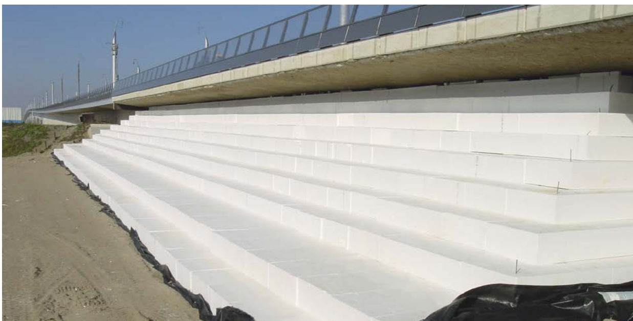
EPS als zettingsvrij materiaal bij HSL-brug Moerdijk