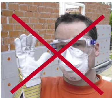
Bij andere materialen verplichte beschermingsmiddelen zijn overbodig