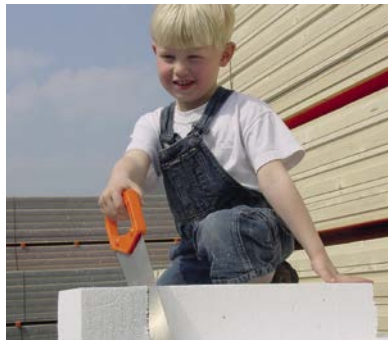
Eenvoudig en snel te verwerken