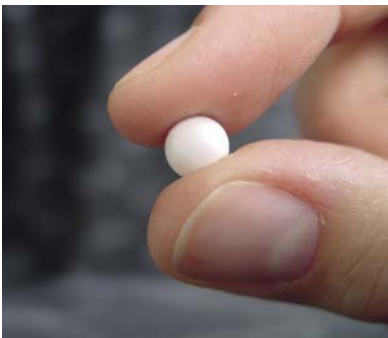
EPS heeft een lange levensduur en is vormvast