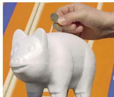
EPS is aantrekkelijk geprijsd