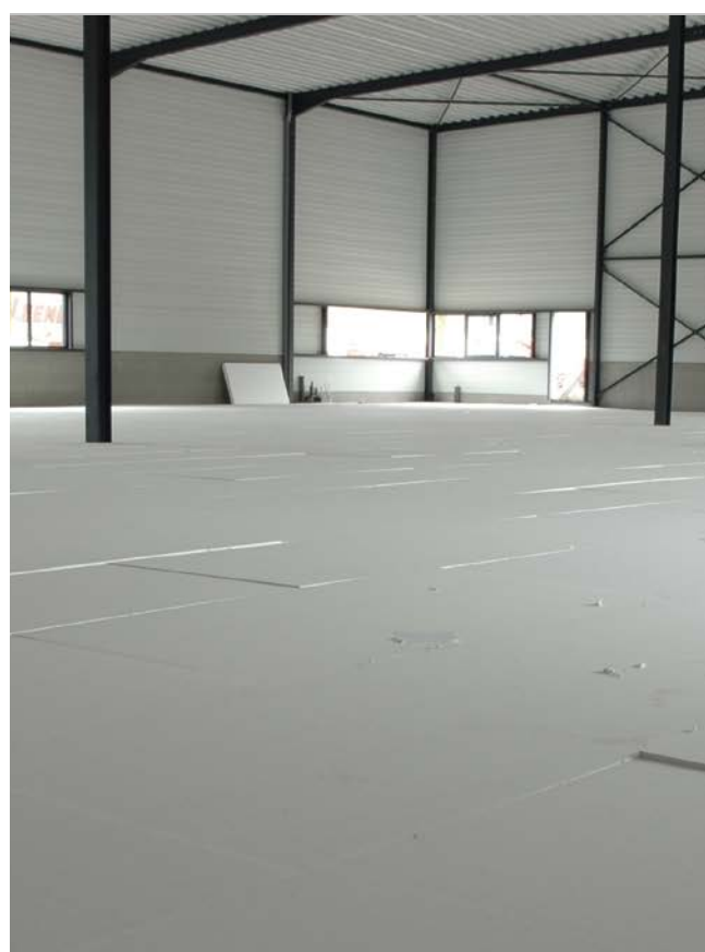
EPS: de ideale vloerisolatie

KOMO productcertificaten CvP 481/1 en K4084. België: ATG-H668.