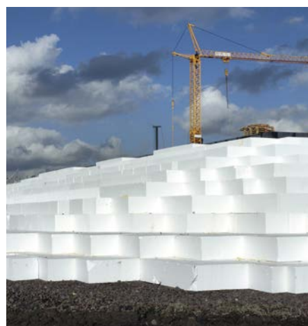
EPS als licht funderingsmateriaal bij grond-, weg- en waterbouw

Meer informatie over deze toepassing vindt u in de 'IsoBouw GWW' brochure of op onze website.