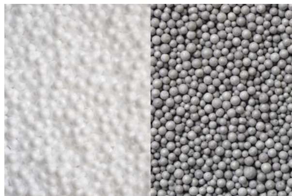
Ook verkrijgbaar als losse EPS en EPS HR parels