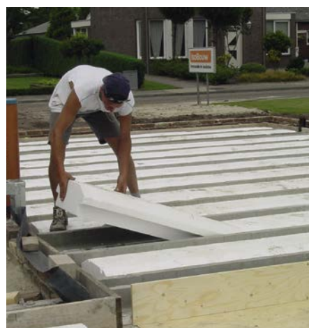
Toepassing vloerisolatie door middel van vormdelen