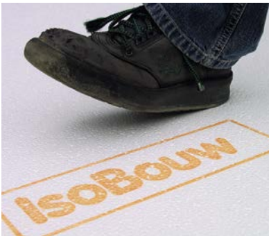
Drukvast en uitstekend beloopbaar