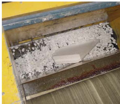
EPS is 100% recyclebaar