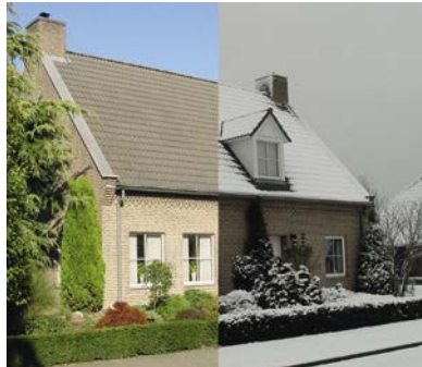
Hoge blijvende isolatiewaarden in de winter .... en in de zomer