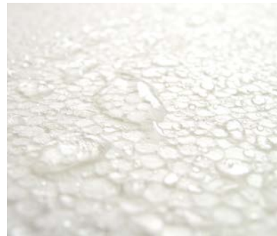
Eps is ongevoelig voor vocht